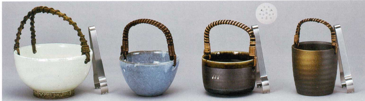
27909-436 7,300円 254327723 粉引アイスBOX(170×110mm・つる含まず)