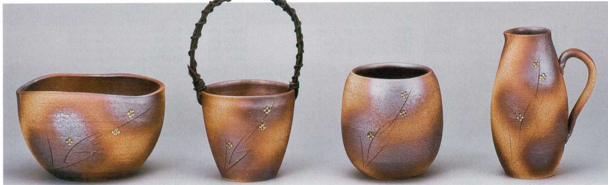
27905-436 7,500円 264327905 火色小花フインクーラー(250×200×140mm)