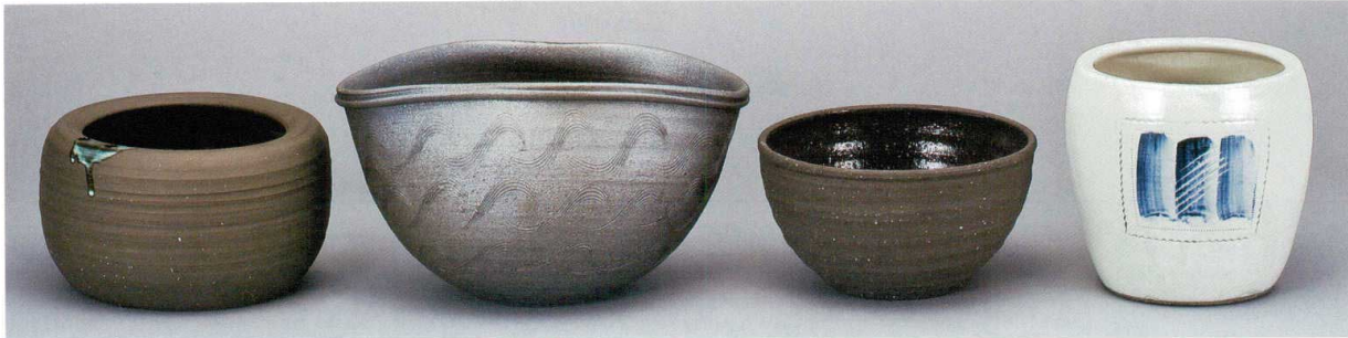
27901-206 18,000円 262027901 黒土手作り冷酒瓶クーラー(オリジナル)(230×130mm)