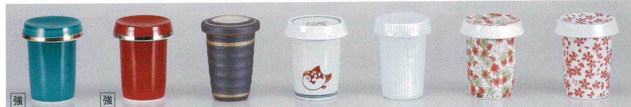
28121-336 2,500円 253327118 白釉ヒレ酒 (手造り) (約90mm)