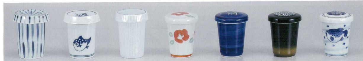
28131-286 1,200円 262828131 二段十草ヒレ酒 (85×92mm)