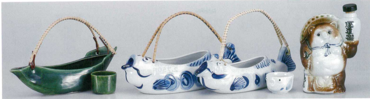
28101-336 4,450円 253327106 笹舟骨酒 (280×85×95mm・560cc) 28102-336 720円 253327107 織部骨酒ぐい呑 (60×45mm)