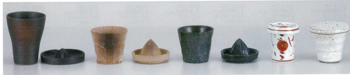
28114-106 1,400円 251027128 備前風蓋付焼酎カップ (109×150mm・450cc)