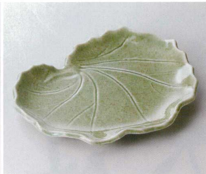
02906-086 1,560円 250822415 つわぶき23cm中皿 (227×187×27mm)