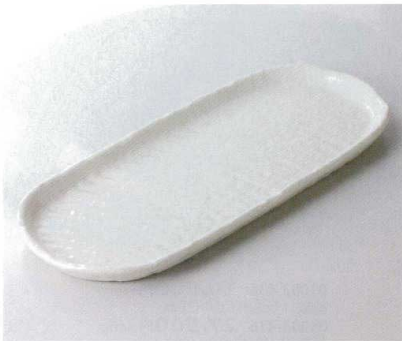
02905-416 1,600円 254115607 白マット小判ステーキ皿 (370×160×17mm)