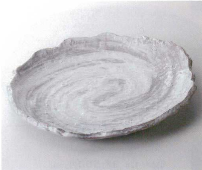
02901-486 1,250円 264802901 うず潮8.0皿 (248×218×38mm) 02902-486 2,100円 264802902 うず潮10.0皿 (310×270×43mm)