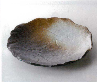
02903-086 1,600円 250819225 黒ダイヤ吹木の葉9.0皿 (280×278×42mm)