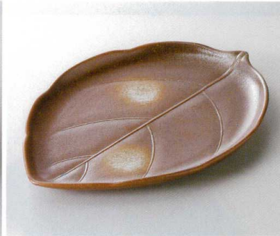
02904-206 1,550円 252022412 茶伊賀白吹葉型和風大皿 (290×212×25mm)