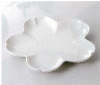
02909-086 1,300円 250822414 アイボリーさくらプレート (231×23mm)