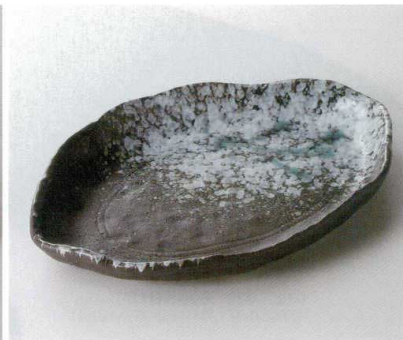
02910-276 1,260円 262702910 雪化粧木の葉バスタ皿 (258×183×30mm)