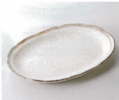
02912-186 1,250円 261802912 白唐津楕円盛皿 (285×218×25mm)