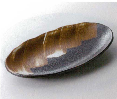
02911-306 1,250円 263002911 黒斑点刷毛楕円大鉢 (320×180×43mm)