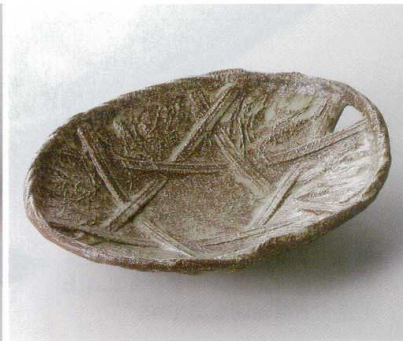
02907-186 1,400円 261802907 窯変和紙盛鉢 (248×203×55mm)