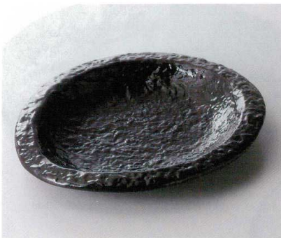
02908-226 1,490円 262202908 黒袖帽子型7.0皿 (230×205×35mm)