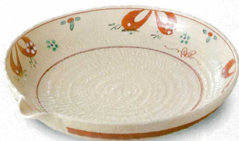
03006-056 15,300円 250524706 赤絵片口尺二大皿 (345×70mm)