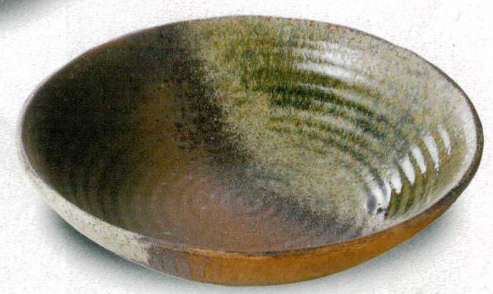
03011-436 8,600円 254324604 11.0火色灰釉吹大鉢 (330×80mm) 03012-436 12,200円 254324605 13.0火色灰釉吹大鉢 (390×85mm)