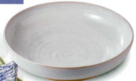
03001-126 38,500円 251224601 白萩釉15号浅鉢 (460×460×115mm)