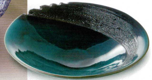
03002-436 10,000円 254324204 緑釉11号丸鉢 (350×70mm) 03003-436 27,500円 264303003 緑釉13.7皿鉢 (410×100mm)

創造力をかき立てる大鉢は テーブルの上でひととき存在感を 主張する個性的な器です。