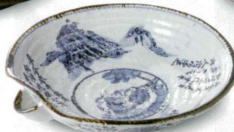
03007-306 7,250円 253024608 片口唐山水9.0盛鉢 (267×250×65mm) 03008-306 11,200円 253024609 片口唐山水尺盛鉢 (330×315×80mm) 03009-306 16,000円 253024610 片口唐山水尺2盛鉢 (375×355×88mm)