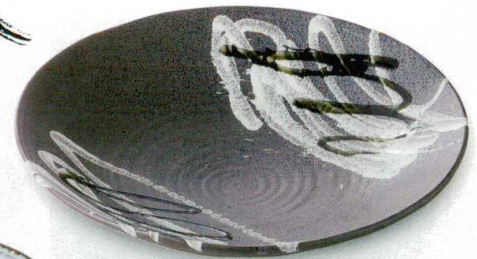
03010-116 14,000円 261103010 黒釉乱線変形12.0丸大鉢軽量 (360×90mm)