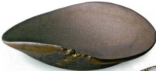
03004-436 10,400円 254324305 金彩たわみ12.0鉢 (360×275×110mm) 03005-436 27,500円 264303005 金彩たわみ14.0鉢 (425×365×120mm)