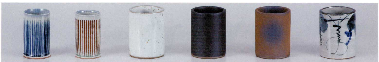
30829-456 1,500円 254530109 御深井青十草箸立 (55×105mm) 30830-456 1,500円 254530108 御深井赤十草箸立 (55×105mm) 30831-206 1,000円 251030102 粉引箸立 (80×110mm) 30832-206 1,000円 252030103 黒釉箸立 (80×110mm) 30833-206 1,000円 252030104 備前箸立 (80×110mm) 30834-476 1,000円 264730834 粉引巻ぶどう箸立 (80×105mm)