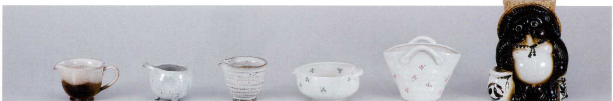
30823-436 1,650円 254330137 チタン掛分けドレッシングピッチャー (105×75×65mm) 30824-086 1,100円 260830824 粉引青地片口(小) (80×63×56mm) 30825-436 1,430円 254330136 チタンドレッシングピッチャー (70×85×60mm) 30826-476 980円 264730826 クローバーお玉立(緑) (125×110×50mm) 30827-476 1,000円 264730827 クローバー しゃもじ立(赤) (130×75×100mm) 30828-436 3,300円 254330111 狸のはし立て・楊枝入付 (130×120×160mm)