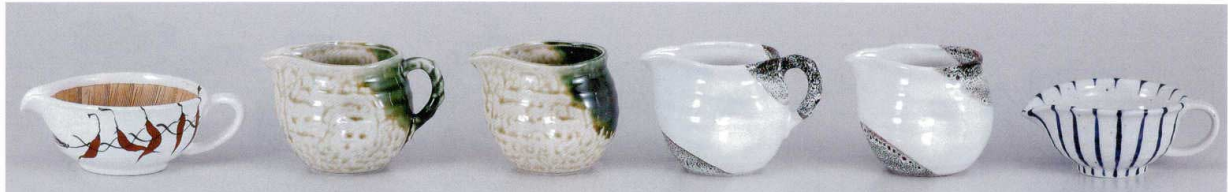
30809-456 1,400円 254530131 ぶちぶちがら・刺身鉢ドレッシング(小) (104×105×50mm・190cc) 30810-456 1,800円 254530132 ぶちぶちがら・刺身鉢ドレッシング(大) (165×115×50mm・270cc) 30811-166 1,500円 251630121 伊羅保ドレッシング (380cc) 30812-166 1,200円 251630123 伊羅保汁次 (380cc) 30813-166 1,500円 251630122 柚子ヌリ分ドレッシング (380cc) 30814-166 1,200円 251630124 柚子ヌリ分汁次 (380cc) 30815-036 840円 260330815 ゴス十草ドレッシング(小) (100×87×48mm) 30816-036 1,250円 260330816 ゴス十草ドレッシング(大) (120×102×56mm)