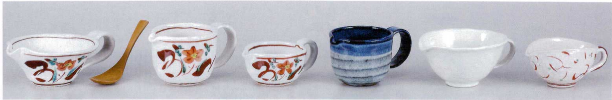
30801-456 4,200円 254530113 志野赤絵手付サラダ鉢(210×160×70mm) 30802-456 1,600円 254530114 竹スプーン(173mm) 30803-456 3,600円 254530115 志野赤絵手付タレ入 (115×90mm・450cc) 30804-456 3,150円 254530116 志野赤絵手付片口鉢 (110×65mm・250cc) 30805-456 2,300円 254530805 手廻りソーム手付タレ入・小(B) (90×75mm・240cc) 30806-456 2,800円 254530806 手廻りソーム手付タレ入・大(P) (110×95mm・420cc) 30807-026 2,600円 250220126 粉引手付片口中鉢 (160×145×82mm) 30808-406 2,150円 264030808 色絵ドレッシング (153×10×75mm)