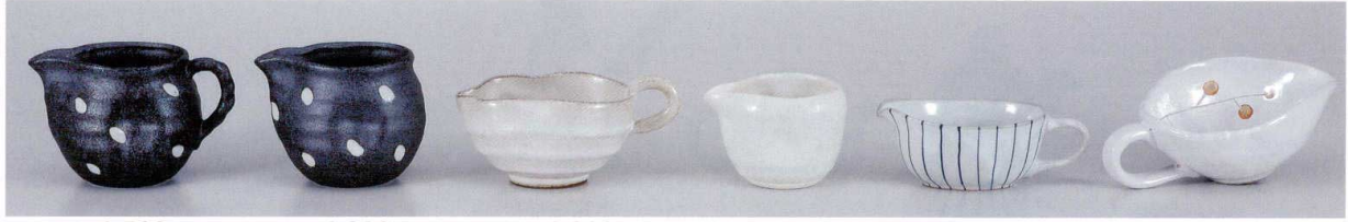
30817-166 1,500円 251630120 チタン掛分けドレッシング (380cc) 30818-166 1,200円 251630125 白斑点汁次 (380cc) 30819-036 1,200円 260330819 白唐津ピッチャー (155×93×64mm) 30820-406 1,200円 254030134 白マツドピッチャー (95×77×67mm) 30821-286 900円 252830138 粉引十草ドレッシング (145×80×45mm) 30822-286 840円 252830117 狸のはし立て・楊枝入付 (165×120×62mm)