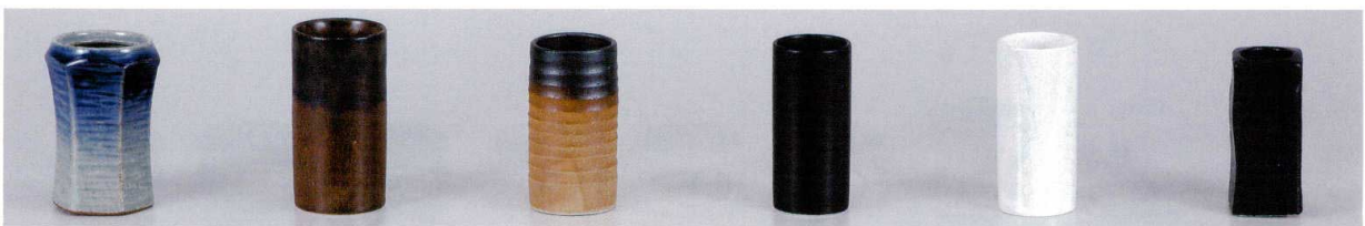
30835-336 1,200円 263330835 コス吹き串立て (75×110mm・175cc) 30836-086 1,150円 260830836 土アメ釉くし立て (58×118mm) 30837-106 700円 251030112 伊賀黒サビ串入 (56×120mm) 30838-216 460円 252130110 串スティック入れ(黒) (51×112mm・140cc) 30839-216 460円 252130111 串スティック入れ(白) (51×112mm・140cc) 30840-206 400円 2652030840 黒石角焼き鳥・おでん串入れ (45×45×105mm)