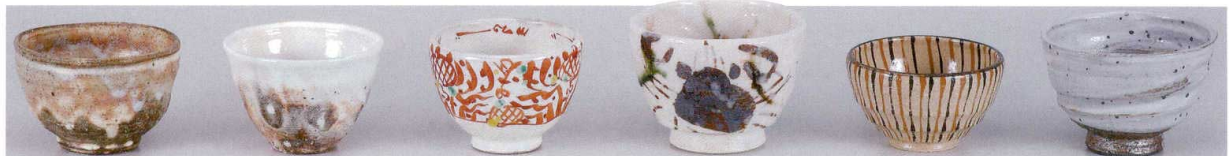
32625-436 3,200円 254331901 灰釉くみ出し (93×67mm) 32626-436 2,700円 264332626 あけぼの湯呑 (94×65mm) 32627-086 2,700円 250831908 赤絵ヘルシヤ紋湯呑(朱) (90×70mm) 32627-086 2,700円 250831908 赤絵ベルシヤ紋湯呑(朱) (90×70mm) 32629-456 2,100円 264532629 麦わら十草干茶 (92×55mm) 32630-436 1,980円 254331904 白刷毛目汲出し (100×70mm)