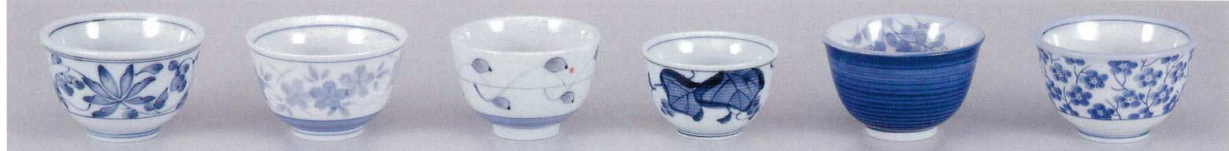
32601-056 400円 250532213 鉄仙厚口反煎茶 (95×56mm) 32602-056 400円 250532221 うす墨さくら反干茶 (90×58mm) 32603-056 400円 250532226 唐草京形煎茶 (73×60mm) 32604-276 400円 262732604 染ぶどう小煎茶 (77×50mm) 32605-126 390円 251232305 ゴス巻ハギ反煎茶厚口 (90×58mm) 32606-126 390円 251232304 梅散厚口反煎茶 (90×58mm)