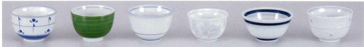
32607-056 390円 260532607 めばえ干茶 (90×57mm) 32608-256 380円 252532218 グリーン巻厚口煎茶 (85×58mm) 32609-126 360円 251232303 暈反厚口煎茶 (90×58mm) 32610-076 360円 250732223 スミレ煎茶 (78×51mm) 32611-156 360円 251532317 厚口二色筋反干茶 (98×50mm) 32612-056 350円 250532227 梅壺煎茶 (85×55mm)