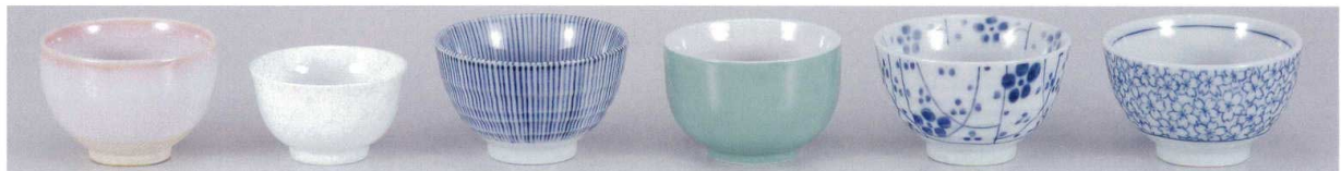
32619-026 300円 252032240 桜うのふ煎茶 (79×57mm) 32620-406 300円 254032231 白小干茶 (72×45mm) 32621-206 290円 262032621 内外細呉須十草干茶 (91×55mm) 32622-376 220円 253732243 ヒスイ食堂湯呑 (82×52mm) 32623-266 210円 252632242 小梅煎茶 (92×57mm) 32624-266 210円 252632244 花ちらし煎茶 (92×57mm)