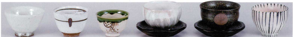
32637-436 1,480円 254331905 粉引せり湯呑 (95×65mm) 32638-286 1,450円 252831915 かいらぎ小紋煎茶 (87×65mm) 32639-456 1,450円 254331915 織部反煎茶(手造り) (85×55mm) 32640-186 1,400円 251831843 粉引大名干茶(100×67mm) 32641-186 820円 251831844 手彫り茶托(133×25mm) 32642-186 1,400円 251831841 備前風丸紋大名煎茶(100×67mm) 32643-186 820円 251831842 手彫り茶托(133×25mm) 32644-226 1,380円 262232644 陶碗ゴス十草 (92×72mm)