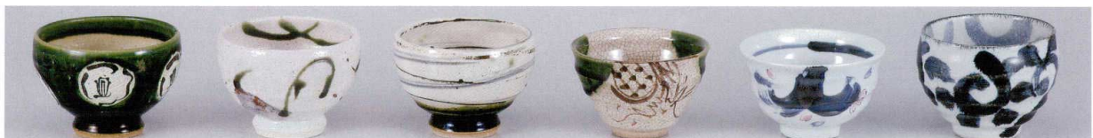
32631-086 1,700円 260832631 織部椿ゆったり碗 (100×75mm) 32632-086 1,700円 260832632 志野織部流ゆったり碗 (100×75mm) 32633-076 1,600円 260732633 織部スパイラル干茶 (105×72mm) 32634-456 1,600円 264532634 織部天目型干茶(手造り) (98×65mm) 32635-336 1,560円 263332635 ゴスハケメ桜ちらしゆったり干茶 (100×65mm) 32636-406 1,500円 254031849 新タコイラギ (100×72mm)