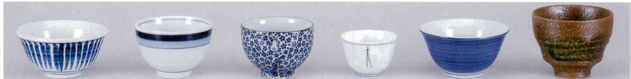
32613-156 340円 251532310 厚口太十草反煎茶 (98×50mm) 32614-066 330円 250632237 ライン厚口煎茶 (84×57mm) 32615-026 390円 250232236 さくらさざぎ煎茶 (80×58mm) 32616-056 330円 250532138 松葉玉露煎茶 (62×45mm) 32617-156 320円 251532315 厚口千段ゴス巻反干茶 (98×50mm) 32618-206 320円 252032042 栗伊賀煎茶 (86×68mm)