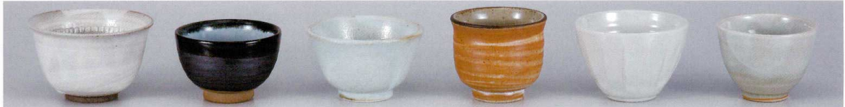
32821-406 500円 254032016 京唐津結干茶 (97×62mm) 32822-336 480円 253332030 サビ巻煎茶 (83×56mm) 32823-286 450円 252832025 白唐津厚口煎茶 (93×55mm) 32824-026 450円 260332824 赤志野干茶 (76×66mm) 32825-056 430円 260532825 粉引ソギ干茶 (90×63mm) 32826-326 420円 253232214 白垂煎茶 (83×61mm)