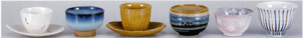
32813-026 580円 250231837 こまき煎茶 (73×53mm) 32815-076 570円 250732005 青雲高台干茶 (87×55mm) 32816-076 550円 250731835 ブリック干茶 (74×61mm) 32818-056 540円 260532818 黒伊賀うのふー一服碗 (90×62mm) 32819-066 520円 250632017 志野春秋干茶 (90×55mm) 32820-156 510円 261532820 二色十草干茶 (92×67mm)