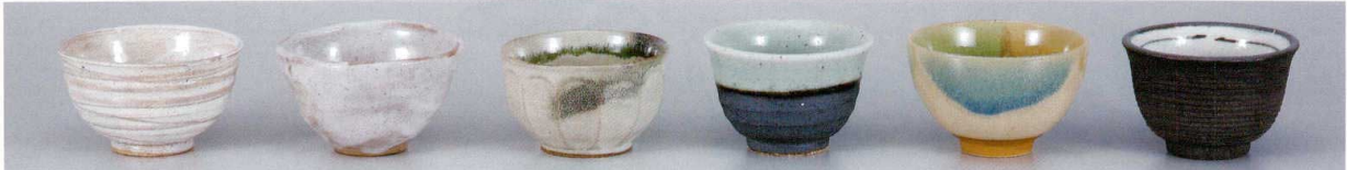
32801-066 650円 250632007 美濃はぎ線彫煎茶 (91×54mm) 32802-316 640円 263132802 手造り風志野変形煎茶 (96×90×57mm) 32803-286 630円 252832011 天竜流しソギ煎茶 (90×55mm) 32804-336 630円 263332804 鉄砂緑貴入反干茶 (87×58mm) 32805-036 630円 260332805 三彩貴入干茶 (92×58mm・170cc) 32806-076 630円 260732806 焼ペヌリワケ反干茶 (87×58mm)