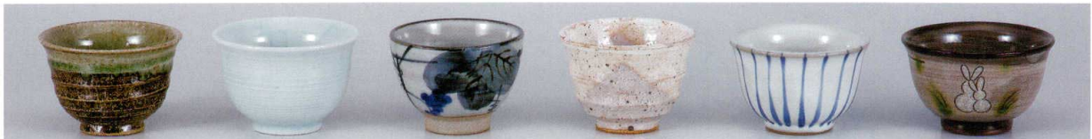
32807-036 620円 250332010 ヒロ灰釉反煎茶 (86×58mm) 32808-026 600円 260332808 千段青磁干茶 (91×60mm) 32809-476 600円 254732018 粉引巻ぶどう干茶 (84×57mm) 32810-076 600円 250732008 美濃萩煎茶(小) (84×60mm) 32811-056 590円 250532021 ゴス十草煎茶 (88×60mm) 32812-476 650円 264732812 月見うさぎ煎茶 (90×55mm)