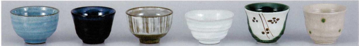
32839-036 350円 250332036 ブルーカイヤギ干茶 (90×58mm) 32840-036 350円 250332035 黒結晶ナマコ反煎茶 (82×59mm) 32841-276 340円 252732027 土物刷毛煎茶 (88×57mm) 32842-476 330円 254732032 粉引干茶 (94×50mm) 32843-266 290円 262632843 オリハ梅反干茶 (85×65mm) 32844-266 290円 252632038 マット水玉反干茶 (85×65mm)