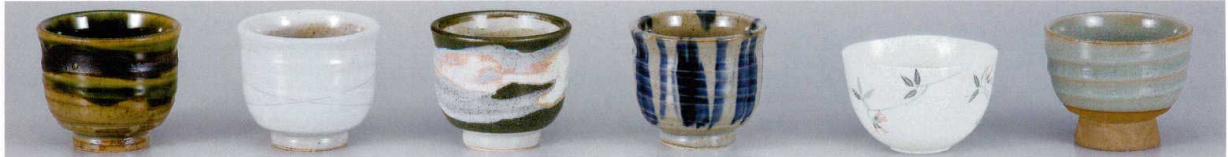
32827-036 410円 260332827 織部流し干茶 (76×66mm) 32828-036 410円 260332828 粉引ライン干茶 (76×66mm) 32829-036 410円 260332829 流れ雲干茶 (76×66mm) 32830-036 410円 260332830 ゴス十草干茶 (76×66mm) 32831-076 400円 250732241 白マット花つなぎ波切干茶 (81×50mm) 32832-166 400円 251632040 ヒロ貴入干茶 (78×63mm)