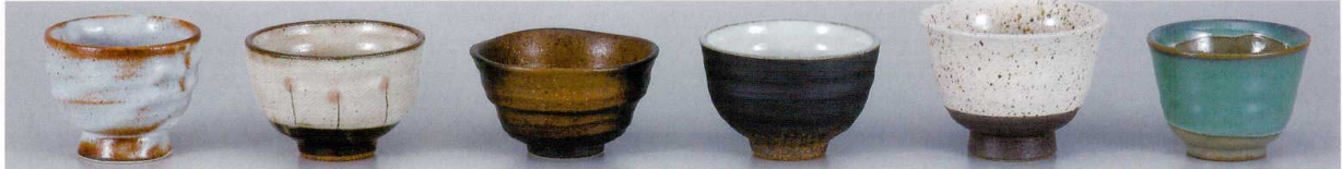
32833-166 400円 251632041 ネズミ高台干茶 (78×64mm) 32834-286 390円 252851575 野花煎茶 (88×60mm) 32835-276 370円 252732031 黒備前変形煎茶 (93×51mm) 32836-036 370円 260332836 南蛮ヌリ分干茶 (90×57mm) 32837-216 370円 262132837 灰釉ヌリ分干茶 (92×69mm・200cc) 32838-056 350円 250532218 ヒワグリン反煎茶 (82×52mm)