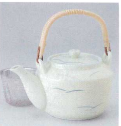
33613-336 3,650円 草花茶こし付土瓶6号(840cc) 33614-336 4,900円 草花茶こし付土瓶8号(1260cc) 33615-336 6,100円 草花茶こし付土瓶10号(1450cc)