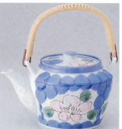
33628-336 3,100円 山茶花土瓶6号(840cc) 33629-336 4,200円 山茶花土瓶8号(1260cc) 33630-336 5,100円 山茶花土瓶10号(1450cc)