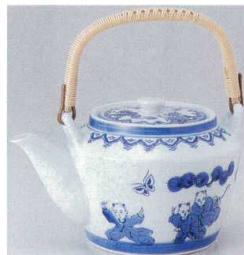
33631-336 3,100円 唐子土瓶6号(840cc) 33632-336 4,200円 唐子土瓶8号(1260cc) 33633-336 5,100円 唐子土瓶10号(1450cc)