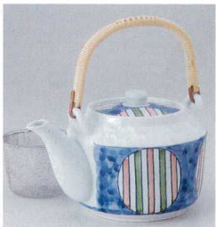
33622-336 3,650円 格子万能茶こし付土瓶6号(840cc) 33623-336 4,900円 格子万能茶こし付土瓶8号(1260cc) 33624-336 6,100円 格子万能茶こし付土瓶10号(1450cc)