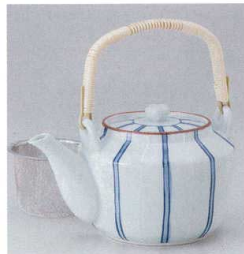
33601-336 3,800円 手提が十草万能茶こし付土瓶6号(840cc) 33602-336 5,300円 手提が十草万能茶こし付土瓶8号(1260cc) 33603-336 6,300円 手提が十草万能茶こし付土瓶10号(1450cc)