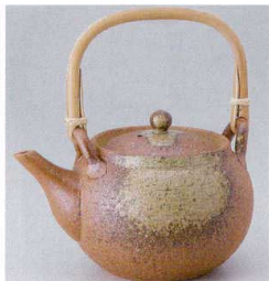
33645-436 6,820円 信楽土瓶(大) (130×95mm・750cc)