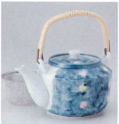
33610-336 3,650円 木万能茶こし付土瓶6号(840cc) 33611-336 4,900円 木万能茶こし付土瓶8号(1260cc) 33612-336 6,100円 木万能茶こし付土瓶10号(1450cc)