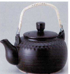
33648-356 3,600円 安心型新熱5.0土瓶(1500cc) 33649-356 3,900円 安心型新熱8土瓶(1700cc) 33650-356 4,800円 安心型新熱10土瓶(2200cc)