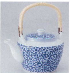
33640-336 2,800円 桜づし6号土瓶(850cc) 33641-336 4,200円 桜づし8号土瓶(1500cc) 33642-336 5,000円 桜づし10号土瓶(1800cc)