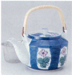
33607-336 3,650円 夕小万能茶こし付土瓶6号(840cc) 33608-336 4,900円 夕小万能茶こし付土瓶8号(1260cc) 33609-336 6,100円 夕小万能茶こし付土瓶10号(1450cc)