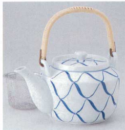
33604-336 3,800円 手提網万能茶こし付土瓶6号(840cc) 33605-336 5,300円 手提網万能茶こし付土瓶8号(1260cc) 33606-336 6,300円 手提網万能茶こし付土瓶10号(1450cc)