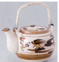
33658-356 1,800円 魚絵土瓶5合(800cc) 33659-356 2,100円 魚絵土瓶8合(1500cc) 33660-356 2,900円 魚絵土瓶10合(2000cc)