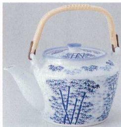
33634-336 3,100円 竹林土瓶6号(840cc) 33635-336 4,200円 竹林土瓶8号(1260cc) 33636-336 5,100円 竹林土瓶10号(1450cc)