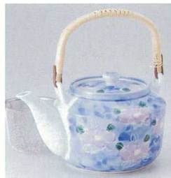
33616-336 3,650円 紫花万能茶こし付土瓶6号(840cc) 33617-336 4,900円 紫花万能茶こし付土瓶8号(1260cc) 33618-336 6,100円 紫花万能茶こし付土瓶10号(1450cc)