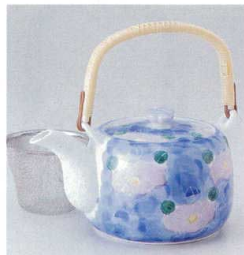
33644-336 2,700円 紫花万能茶こし付土瓶5号 (660cc)