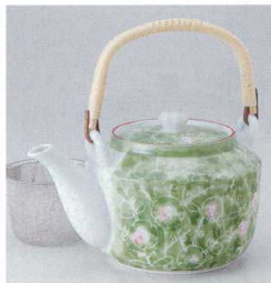
33619-336 3,650円 グン梅万能茶こし付土瓶6号(840cc) 33620-336 4,900円 グン梅万能茶こし付土瓶8号(1260cc) 33621-336 6,100円 グン梅万能茶こし付土瓶10号(1450cc)