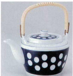
33637-336 2,800円 水玉土瓶5号(850cc) 33638-336 4,200円 水玉土瓶8号(1500cc) 33639-336 5,000円 水玉土瓶10号(1800cc)