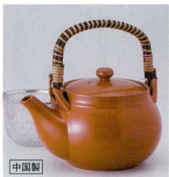
33652-356 2,700円 朱泥8.1(平網カップ網付)H5 (1100cc)