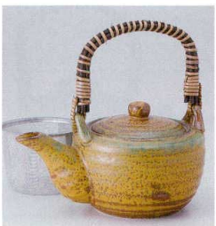
33653-106 2,300円 イラ赤釉8号土瓶(茶こし付) (205×190×H105mm・800cc)