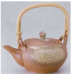
33646-436 6,150円 信楽土瓶(小) (130×75mm・600cc)