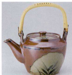
33651-186 3,100円 益子スキ5号土瓶 (180×132×110mm)