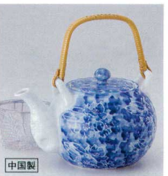
33643-056 2,750円 だみ花6号土瓶(カップアミ) (900cc)