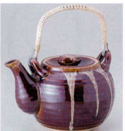
33655-356 1,800円 ロケン土瓶5合(800cc) 33656-356 2,100円 ロケン土瓶8合(1500cc) 33657-356 2,900円 ロケン土瓶10合(2000cc)