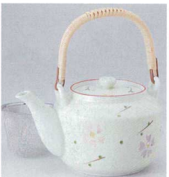
33625-336 3,650円 しだれ梅万能茶こし付土瓶6号(840cc) 33626-336 4,900円 しだれ梅万能茶こし付土瓶8号(1260cc) 33627-336 6,100円 しだれ梅万能茶こし付土瓶10号(1450cc)