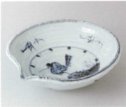
03404-136 4,450円 251324406 御深井染付片口尺寸鉢 (300×290×90mm)