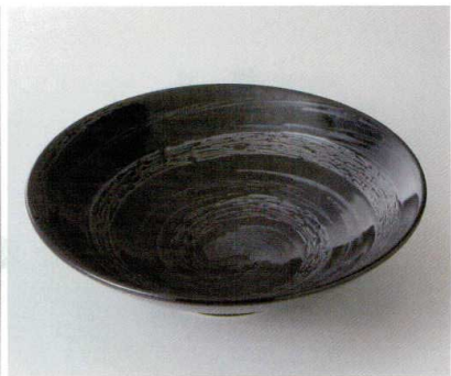
03412-476 1,400円 264703412 早瀬淡黒9.0盛鉢 (285×80mm)