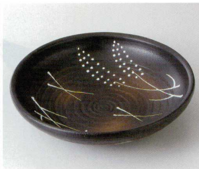
03411-486 3,400円 264803411 黒吹き麦10.0めん鉢 (296×76mm)