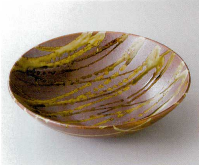
03401-306 5,200円 253024502 明世茶戸草尺鉢 (300×80mm)