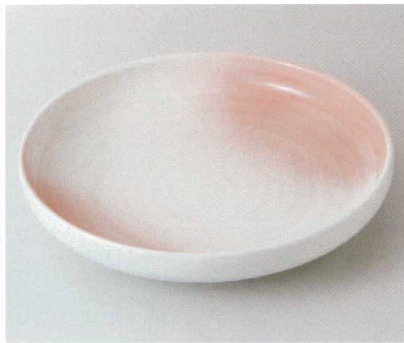
03408-276 4,000円 252724507 石目アイボリー尺盛鉢 (309×58mm)