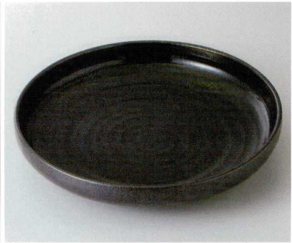
03406-236 4,300円 252324506 黒伊賀吹石目10.0盛鉢 (312×60mm)