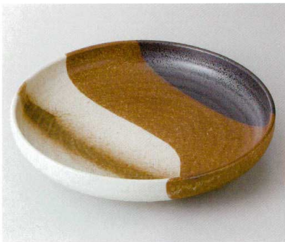
03407-306 4,200円 253019709 茶黒織部ドラ鉢 (310×310×60mm)