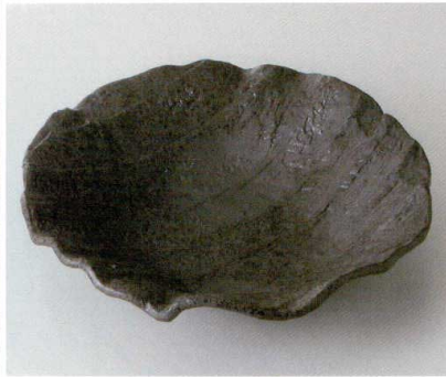
03405-306 4,400円 263003405 黒炭化土甲ら型皿(大) (300×280×70mm)