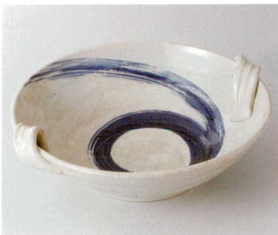
03410-486 3,600円 264803410 呉須刷毛目9.0手付盛鉢 (315×290×98mm)