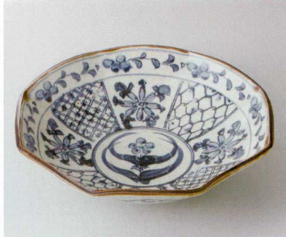
03402-306 4,600円 253024504 染付四君子尺鉢 (300×80mm)