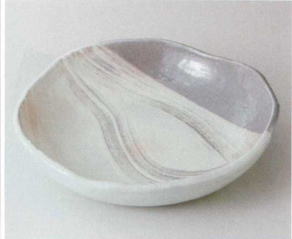
03403-336 4,600円 253324501 白灰流し洩グレー尺鉢 (300×70mm)