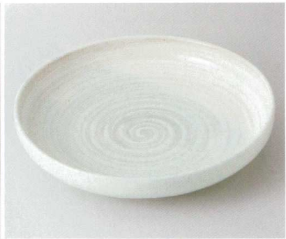
03409-286 3,950円 252824503 東風尺盛鉢 (315×60mm)