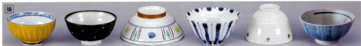
34015-156 890円 261534015 黄釉面取草紋丸碗 (102×54mm) 34016-286 840円 262834016 天の川飯碗 (110×57mm) 34017-186 830円 251837416 点心飯井 (140×60mm) 34018-056 880円 250533435 ゆらぎ十草飯碗(大) (120×60mm) 34019-206 780円 262034019 クリーム水玉飯碗 (105×71mm) 34020-056 750円 250533501 コスチューム中平 (118×56mm)