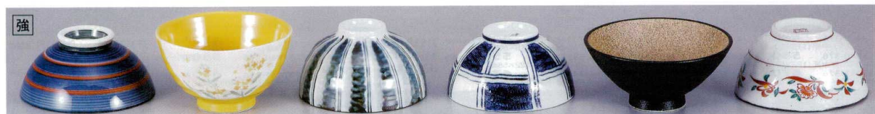
34021-316 760円 253133206 胸筋中青 (115×56mm) 34022-476 720円 254733507 なのはな茶碗 (66×127mm) 34023-176 700円 261734023 藍染十草リップル茶碗 (110×64mm) 34024-036 680円 260334024 きずな市松茶碗 (112×58mm) 34025-306 650円 263034025 珠装4.2ライス井 (124×58mm) 34026-166 660円 251633510 赤絵花中平 (113×58mm)