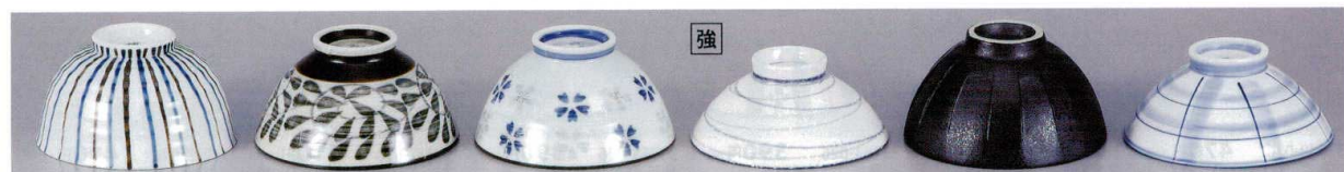
34033-156 510円 261534033 二色十草飯碗 (113×65mm) 34034-206 500円 262034034 錆巻き唐草飯碗 (115×63mm) 34035-206 500円 262034035 濃淡桜紋飯碗 (115×63mm) 34036-326 500円 263234036 かすみ二色滴中平 (114×51mm) 34037-266 470円 262634037 黒金彩吹飯碗 (115×65mm) 34038-326 460円 252323230 格子中平 (116×52mm)