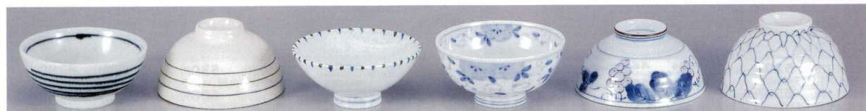
34027-216 630円 262134027 呉須ライン飯碗(小) (112×50mm) 34028-026 630円 260234028 シックラインいっぶく飯碗 (114×60mm) 34029-316 590円 253133223 潤二色十草中平 (117×50mm) 34030-056 560円 250533465 軽量つる花中平 (115×57mm) 34031-056 560円 250533464 軽量ぶどう中平 (115×57mm) 34032-156 510円 261534032 外アミ飯碗 (113×65mm)