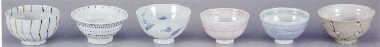
34001-126 1,800円 251233599 色入十草丸碗 (110×110×65mm) 34002-036 1,700円 260334002 点紋茶碗 (120×60mm) 34003-326 1,600円 252323462 つゆ草茶碗 (110×63mm) 34004-316 1,400円 253133527 赤千筋飯碗小(102×59mm) 34005-316 1,500円 253133528 赤千筋飯碗中(113×66mm) 34006-316 1,280円 253133525 紺千筋飯碗小(102×59mm) 34007-316 1,400円 253133526 紺千筋飯碗中(113×66mm) 34008-156 1,260円 261534008 春夏秋冬飯碗(冬) (115×60mm)