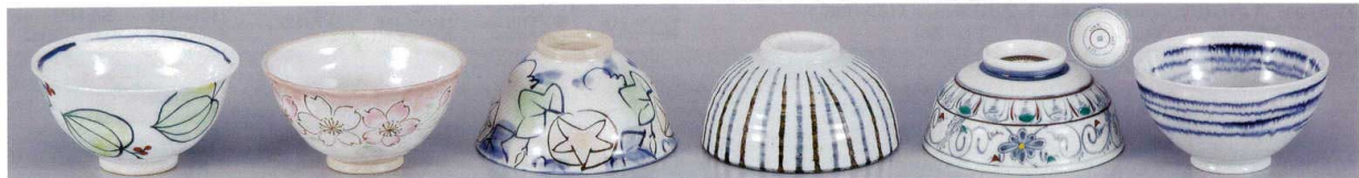
34009-156 1,260円 261534009 春夏秋冬飯碗(秋) (115×60mm) 34010-156 1,260円 261534010 春夏秋冬飯碗(春) (115×60mm) 34011-156 1,260円 261534011 春夏秋冬飯碗(夏) (115×60mm) 34012-086 1,250円 250833518 錆十草茶碗 (116×64mm(120入)) 34013-086 900円 2608334013 安南中平 (117×57mm) 34014-216 900円 262134014 貴入呉須ライン飯碗 (110×61mm)