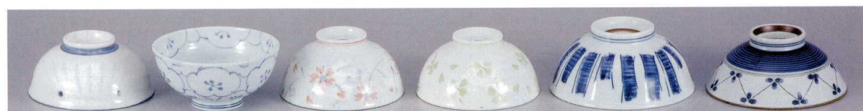
34039-206 450円 262034039 白釉小点紋茶碗 (115×55mm) 34040-256 440円 262534040 梅軽量茶碗 (120×60mm) 34041-256 440円 262534041 桜軽量茶碗 (120×60mm) 34042-256 440円 262534042 ハビネス軽量茶碗 (120×60mm) 34043-206 430円 252033558 筆十草大茶 (140×63mm) 34044-026 430円 260234044 三ツ葉反型大平 (131×56mm)