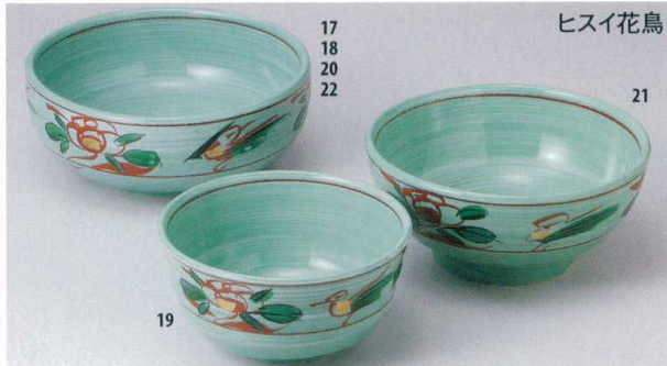
⑰ 35117-186 1,500円 4.0ボール (115×45mm) ⑳ 35120-186 3,350円 6.0ボール (183×82mm) ⑱ 35118-186 2,150円 5.0ボール (155×65mm) ㉑ 35121-186 3,800円 6.5井 (195×90mm) ㉒ 35119-186 2,850円 5.5多用井 (170×90mm) ㉒ 35122-186 4,200円 7.0ボール (215×85mm)