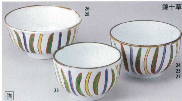
⑳ 35123-166 2,200円 4.0多用碗 (126×78mm) ㉖ 35126-166 3,350円 5.5深口井 (169×89mm) ㉘ 35124-166 2,500円 4.5夏目井 (136×88mm) ㉗ 35127-166 3,550円 5.5夏目井 (168×100mm) ㉙ 35125-166 3,100円 5.0夏目井 (152×96mm) ㉘ 35128-166 3,800円 6.5深口井 (191×94mm)