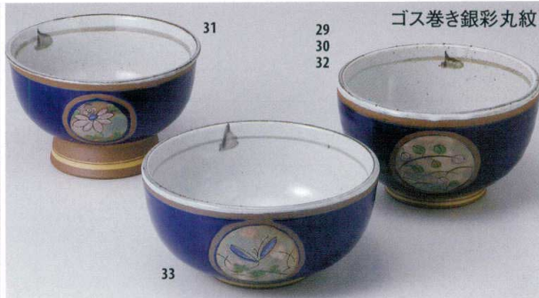
㉚ 35129-186 2,250円 夏目4.5井 (138×90mm) ㉜ 35132-186 3,350円 夏目5.5井 (167×101mm) ㉛ 35130-186 2,900円 夏目5.0井 (150×95mm) ㉝ 35133-186 3,750円 6.0平鉢 (183×90mm) ㉜ 35131-186 3,300円 大名井 (168×105mm)