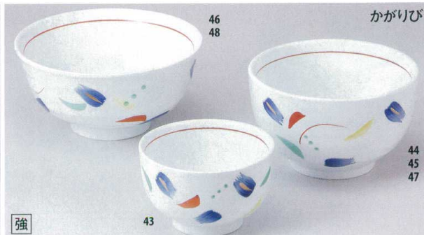
㊴ 35143-336 2,300円 深口4.0井 (125×78mm) ㊶ 35146-336 3,200円 5.5反六井 (173×90mm) ㊵ 35144-336 2,450円 4.5夏目井 (138×90mm) ㊷ 35147-336 3,400円 5.5夏目井 (168×100mm) ㊸ 35145-336 3,000円 5.0夏目井 (153×95mm) ㊸ 35148-336 3,700円 6.5反六井 (193×97mm)