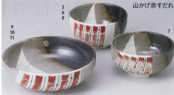
⑤ 35105-026 1,280円 4.2深井 (131×82mm) ⑨ 35109-026 2,530円 6.5ボール (200×75mm) ⑥ 35106-026 1,580円 5.0井 (149×82mm) ⑩ 35110-026 4,110円 7.0ボール (221×86mm) ⑦ 35107-026 2,030円 5.5高浜井 (172×86mm) ⑪ 35111-026 4,700円 8.0ボール (251×79mm) ⑧ 35108-026 2,480円 5.5深井 (175×99mm)