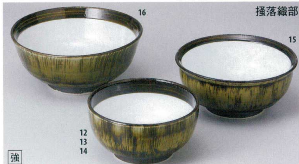
⑫ 35112-166 2,250円 4.0多用碗 (125×74mm) ⑮ 35115-166 4,000円 6.5丸井 (195×88mm) ⑬ 35113-166 2,650円 5.0井 (150×80mm) ⑯ 35116-166 4,450円 7.5大鉢 (223×96mm) ⑭ 35114-166 3,300円 5.5井 (170×85mm)