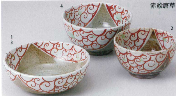
① 35101-456 2,700円 5.0丸鉢 (153×58mm) ③ 35103-456 4,800円 6.5丸鉢 (200×70mm) ② 35102-456 3,150円 夏目井 (5.0) (148×88mm) ④ 35104-456 5,000円 夏目井 (6.0) (180×95mm)