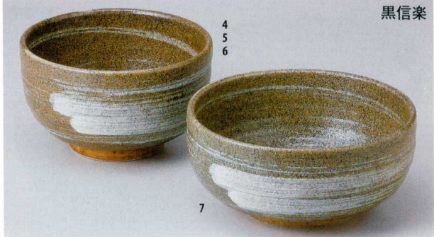
④ 35604-416 1,440円 4.0夏目丼 (115×70mm) ⑤ 35605-416 2,400円 5.0夏目丼 (155×95mm) ⑥ 35606-416 3,240円 5.5夏目丼 (170×100mm) ⑦ 35607-416 3,900円 6.5丼 (195×90mm)