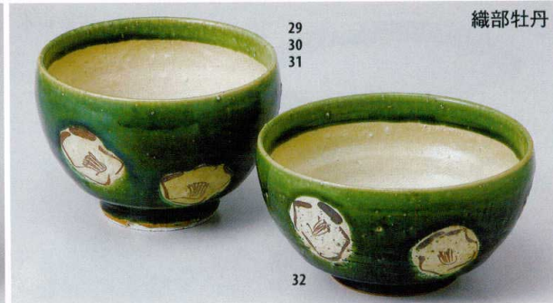
㉙ 35629-076 1,600円 夏目丼(小) (98×72mm) ㉚ 35630-076 2,100円 夏目丼(中) (112×87mm) ㉛ 35631-076 3,000円 夏目丼(大) (147×103mm) ㉜ 35632-076 3,000円 5.5丼 (160×85mm)