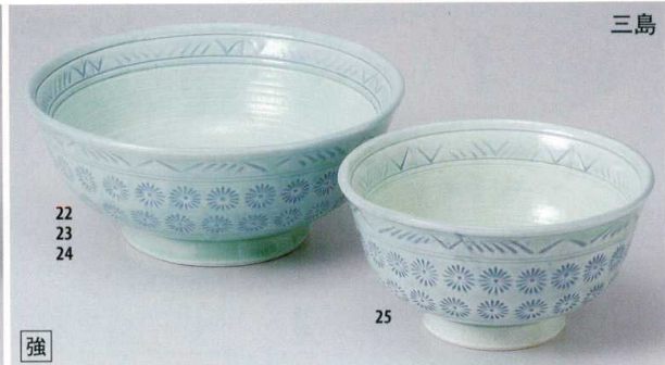
㉒ 35622-166 2,000円 6.0丸丼 (183×75mm) ㉓ 35623-166 2,450円 6.5丸丼 (198×82mm) ㉔ 35624-166 3,100円 7.0丸丼 (214×92mm) ㉕ 35625-166 1,700円 5.5深口丼 (168×89mm)