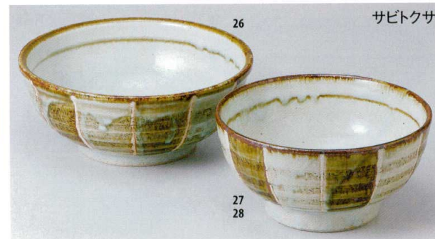
㉖ 35626-056 3,050円 7.0腰張丼 (214×86mm) ㉗ 35627-056 2,000円 5.5高台丼 (170×90mm) ㉘ 35628-056 2,650円 6.0高台丼 (187×95mm)