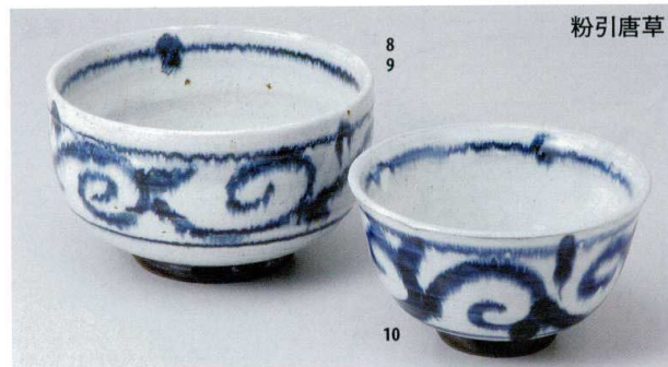
⑧ 35608-036 2,200円 夏目4.8丼 (140×90mm) ⑨ 35609-036 2,400円 夏目5.5丼 (165×95mm) ⑩ 35610-036 2,200円 5.0多用丼 (150×85mm)