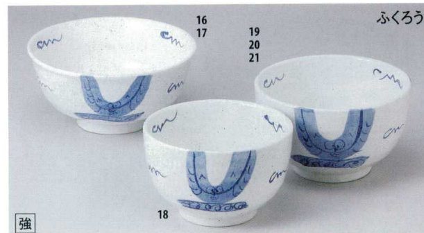
⑯ 35616-336 2,800円 5.5反六兵井 (173×90mm) ⑰ 35617-336 3,300円 6.5反六兵井 (193×97mm) ⑱ 35618-336 1,900円 4.0深口丼 (125×78mm) ⑲ 35619-336 2,000円 4.5夏目丼 (138×90mm) ⑳ 35620-336 2,500円 5.0夏目丼 (153×95mm) ㉑ 35621-336 3,050円 5.5夏目丼 (168×100mm)