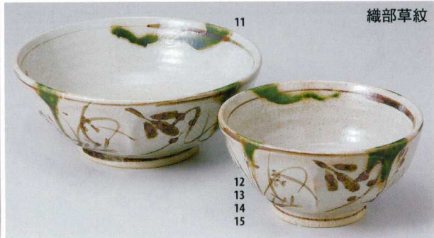
⑪ 35611-086 3,350円 面取7.5鉢 (224×86mm) ⑫ 35612-086 1,450円 面取4.0丼 (122×83mm) ⑬ 35613-086 2,000円 面取4.5丼 (143×87mm) ⑭ 35614-086 2,500円 面取5.0丼 (157×100mm) ⑮ 35615-086 2,700円 面取6.0鉢 (172×86mm)