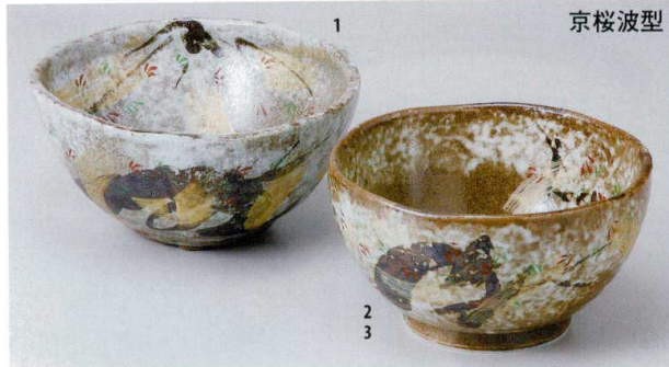
① 35601-186 3,400円 桜木変形5.5丸丼 (173×165×85mm) ② 35602-186 1,950円 4.5丸丼 (128×81mm) ③ 35603-186 2,250円 5.0丸丼 (157×88mm)