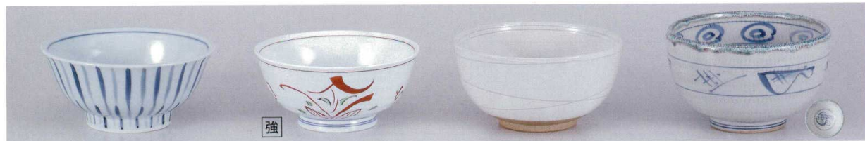
36621-266 2,400円 262636621 京十草多用新丼(185×90mm) 36622-086 2,400円 250851262 手描き京小花5.8多用丼(170×80mm) 36623-306 2,300円 253036124 粉引三島5.5丼(172×87mm) 36624-186 2,300円 251836121 トチリアグ5.5多用丼(165×99mm)