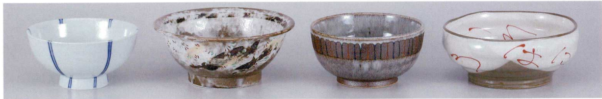
36609-156 2,950円 261536609 六本十草5.3丼(165×81mm) 36610-186 2,900円 261836610 京桜7.0反丼(210×90mm) 36611-186 2,900円 251836110 パステルドリーム夏目形5.5丼(172×88mm) 36612-056 2,800円 280536612 いろは6.5丼(200×85mm)