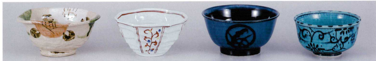
36617-476 2,550円 264736617 山茶花紅花5.5変形丼(195×175×90mm) 36618-126 2,500円 261236618 赤絵唐草八角丼(167×90mm) 36619-086 2,500円 250836201 均窯丸紋6.0反種丼(180×95mm) 36620-286 2,460円 252836122 ベルシャンブルー5.0丼(155×85mm)