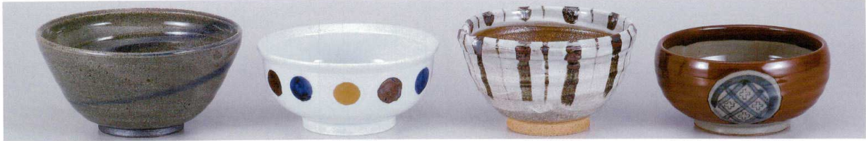
36601-086 5,900円 250836102 唐津風7.0丼手造り(210×105mm) 36602-226 4,360円 362236682 6.8深口腰貼ツバ付金彩丸々(200×92mm) 36603-406 3,800円 364036603 粉引錆十草6.0すり鉢丼(185×180×110mm) 36604-186 3,550円 251836104 茶目天丸紋6.0釜上丼(180×90mm)