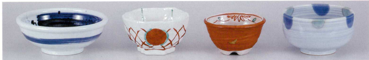
36613-336 2,730円 263336613 コスハケ目玉淵7.3深丼(22×80mm) 36614-186 2,700円 251836613 朱丸紋六角丼(152×162×92mm) 36615-286 2,700円 252836402 朱巻金彩多用丼(150×85mm) 36616-186 2,550円 261836616 涼彩5.5厚口腰張丼(172×90mm)