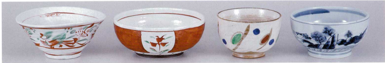
36605-086 3,500円 260836605 赤絵万曆鳳凰7.0変形鉢(208×197×95mm) 36606-186 3,100円 261836606 朱巻間取花7.0ボール(220×88mm) 36607-336 3,100円 253336111 白うす新芽5.0夏目丼(155×95mm) 36608-136 3,200円 251335204 古染6.0釜上丼(180×97mm)