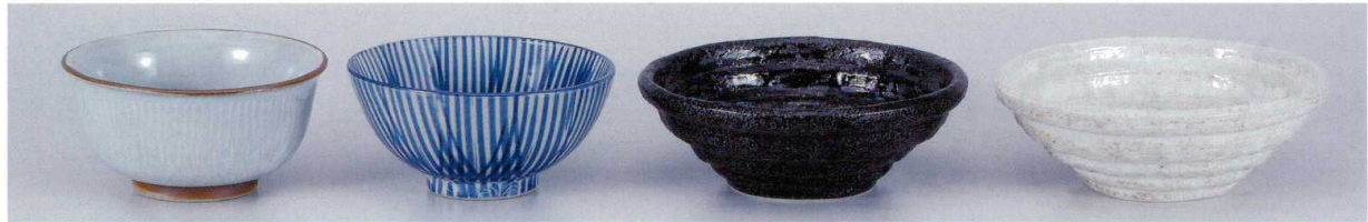
36813-156 1,150円 251536321 口紅乳白5.0丸井(155×82mm)