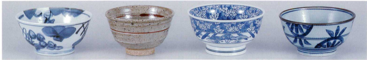
36805-306 1,400円 253036224 水晶ぶどう5.5深口丼(175×87mm)