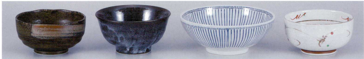
36817-206 1,000円 262036817 豊稔5.0うどん井(155×80mm)