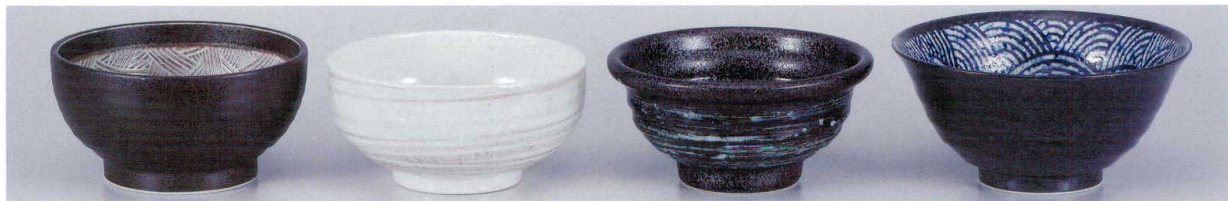
36821-056 940円 250536320 くしめ紋5.5釜上井(170×90mm)