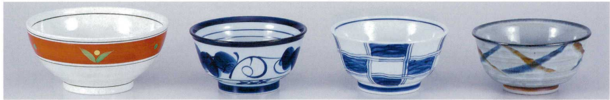
36809-266 1,250円 262636809 佐賀錦釜上井(188×92mm)