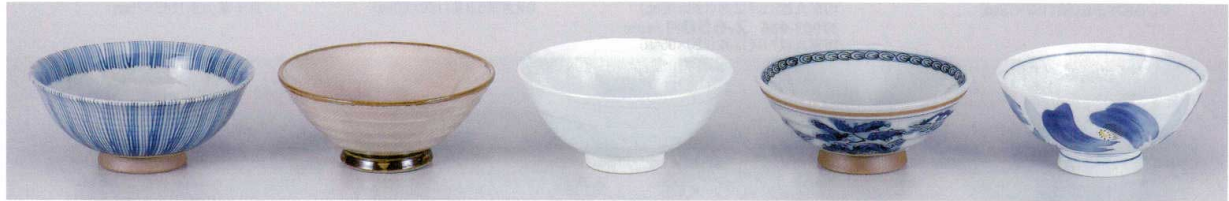
38006-156 980円 251537407 さみだれ大茶 (150×66mm) 38007-416 1,000円 254137512 益子風のり茶身井 (150×65mm) 38008-316 900円 253137412 やよい毛料 (148×70mm) 38009-316 860円 253137514 古染山水毛料 (150×68mm) 38010-326 800円 253237515 花舞毛料 (140×66mm)