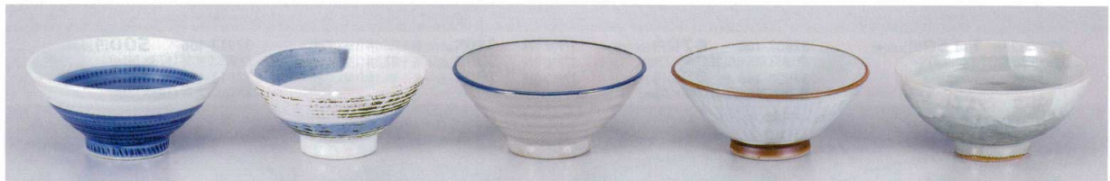
38011-186 650円 251837417 ゴス巻トチリ飯井 (147×70mm) 38012-286 740円 252837526 志野釉刷毛目4.8井 (142×65mm) 38013-416 800円 254137519 緑呉須反4.8井 (145×65mm) 38014-156 680円 251537520 口紅乳白毛料 (150×65mm) 38015-326 680円 253237516 白亜毛料 (146×67mm)