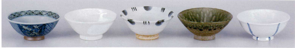
38001-416 1,500円 254137501 祥瑞花のり茶身井 (150×70mm) 38002-156 1,450円 251537504 白ハケメ毛料 (148×65mm) 38003-416 1,440円 254137502 紺実十草毛料 (160×70mm) 38004-456 1,200円 254537506 灰釉荒土のり茶身井 (158×68mm) 38005-416 1,050円 254137509 竹十草厚口毛料 (150×65mm)