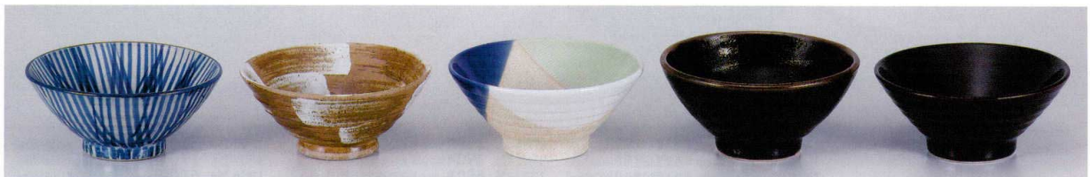
38021-416 800円 254137522 内外ハケメ反4.8井 (145×65mm) 38022-416 800円 254137523 赤志野反4.8井 (145×65mm) 38023-056 650円 250537525 三彩大茶 (150×65mm) 38024-206 600円 262038024 柚子天目5.0厚口大盛ごはん井 (154×75mm) 38025-186 530円 251837420 天目4.8飯井 (148×67mm)