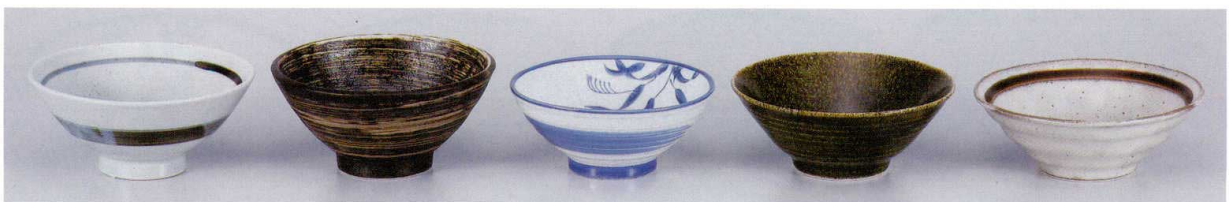
38026-166 450円 251637528 点一引5.0反井 (152×67mm) 38027-476 430円 254737425 至福手びねり5.0井 (150×74mm) 38028-056 420円 250537527 新紺ヌスキ4.5井 (138×62mm) 38029-066 380円 250637430 唐津5.0井 (155×60mm) 38030-266 320円 252637429 茶ライン大茶 (150×60mm)