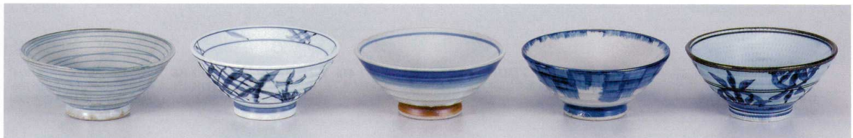
38016-156 680円 251537518 渦潮毛料 (150×63mm) 38017-186 680円 261838017 手描間取菊飯井 (150×70mm) 38018-316 670円 253137418 はるか4.8井 (148×64mm) 38019-416 800円 254137524 ゴスハケ反4.8井 (145×65mm) 38020-056 660円 250537521 トチリ世大茶 (145×66mm)