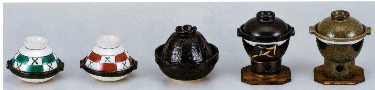
42022-056 1,580円 緑市松耐熱小鍋 (118×110×80mm) 42023-056 1,580円 赤市松耐熱小鍋 (118×110×80mm) 42024-226 3,510円 耐火土黒織部山型一人鍋 (130×105mm) 42025-226 3,190円 全銀彩ミニコンロセット (コンロφ90×78mm・板100×100mm) 42026-226 2,550円 黒ミニ鍋 (110×68mm) 42027-226 2,770円 唐津ミニコンロ一式 (コンロφ90×78mm・板100×100mm) 42028-226 2,550円 唐津ミニ陶板 (110×60mm)