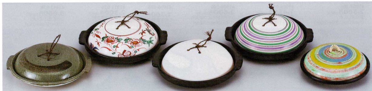
42011-226 3,190円 唐津陶板7号 (198×60mm) 42012-226 5,320円 手書き花鳥陶板 (198×85mm) 42013-226 3,720円 白陶板6.5号 (198×85mm) 42014-226 5,320円 手書きこま筋陶板 (198×85mm) 42015-086 3,700円 五色カスリ5.5陶板 (蓋強化) (167×58mm)