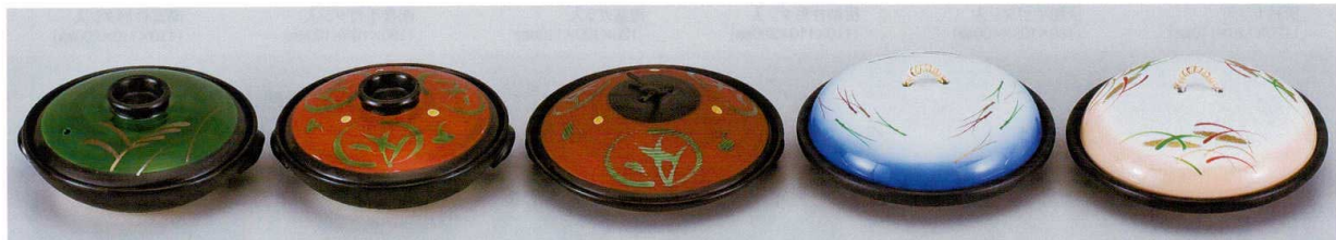
42006-086 3,750円 交趾ススキ絵浅鍋 (耳付) (165×154×73mm) 42007-086 3,750円 朱巻丸紋浅鍋 (耳付) (蓋強化) (165×154×73mm) 42008-086 4,000円 朱巻丸紋陶板鍋 (蓋強化) (183×173×57mm) 42009-086 3,400円 松葉5.5陶板 (蓋強化) (167×58mm) 42010-086 3,400円 加茂川5.5陶板 (蓋強化) (167×58mm)