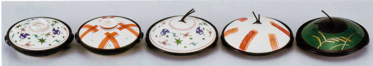
42001-136 3,150円 宝ずし浅鍋 (165×153×68mm) 42002-186 3,200円 洋風カゴメ浅なべ (170×68mm) 42003-136 3,550円 宝ずし陶板 (180×174×60mm) 42004-186 3,650円 洋風小紋陶板なべ (180×65mm) 42005-086 4,000円 交趾ススキ絵陶板鍋 (183×173×57mm)