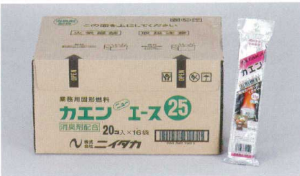
42526-486 12,500円 264842526 ニューエース15(15g×520入) 42527-486 12,500円 264842527 ニューエース20(20g×400入) 42528-486 12,500円 264842528 ニューエース25(25g×320入) 42529-486 12,500円 264842529 ニューエース30(30g×280入)