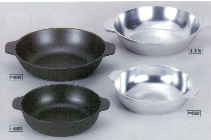
42510-336 5,600円 263342510 黒よせなべ22cm(M11-015)(220×58mm) 42512-336 9,100円 263342512 黒よせなべ28cm(M11-017)(280×75mm) 42514-336 4,700円 263342514 白銀よせなべ22cm(M11-011)(220×58mm) 42516-336 7,800円 263342516 白銀よせなべ28cm(M11-013)(280×75mm) 42511-336 6,900円 263342511 黒よせなべ25cm(M11-016)(250×68mm) 42513-336 11,000円 263342513 黒よせなべ31cm(M11-018)(310×75mm) 42515-336 6,000円 263342515 白銀よせなべ25cm(M11-012)(250×68mm) 42517-336 9,400円 263342517 白銀よせなべ31cm(M11-014)(310×75mm)