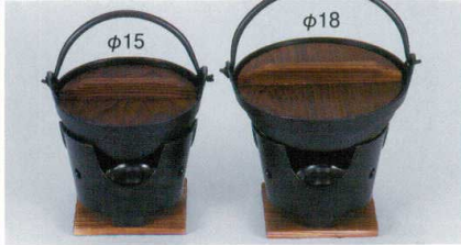
42501-336 3,000円 25330506 あられ冷し物皿(小)(M10-211)(173×50mm) 42502-336 3,000円 25330507 あられ冷し物皿(大)(M10-174)(190×45mm) 42503-336 1,800円 253342007 新ふるさと鍋(黒)のみφ15(M10-002)(150×60mm) 42504-336 2,800円 253342008 新ふるさと鍋(黒)のみφ18(M10-004)(180×65mm) ※丸コンロ火入れ板は別売りです