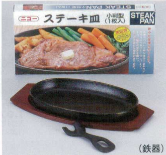
42509-486 2,350円 264842509 小判ステーキ皿(235×142×27mm)