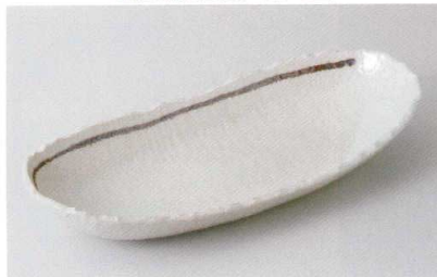
04505-416 2,340円 254116108 カイラギサピライン楕円尺0ボール (310×145×35mm)