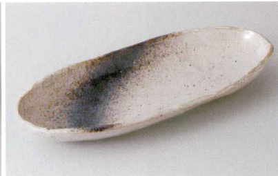
04509-306 2,250円 253016109 銀河石目長皿 (336×142×43mm)