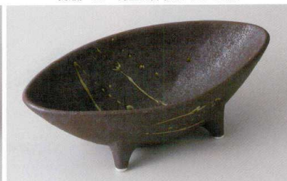
04516-226 2,020円 262204516 四つ足大鉢筆流(黒) (246×132×75mm)