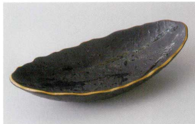
04508-306 2,300円 253002812 黒袖舟形8.5皿 (260×120×55mm)