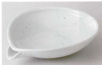
04511-076 2,100円 250716317 白唐津7.0片口平鉢 (230×208×57mm)