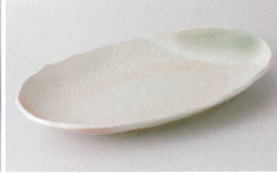
04504-326 2,380円 263204504 彩時空・虹10.0小判鉢 (313×177×40mm)