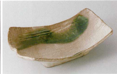
04507-176 2,300円 261704507 織部刷毛変形盛鉢 (260×160×69mm)