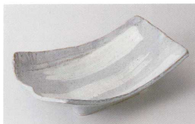
04515-476 2,050円 264716303 均霰粉引変型煮物皿(大) (275×190mm)