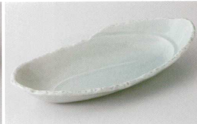
04514-026 2,030円 262204514 本業灰貫入長盛皿 (327×158×51mm)