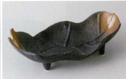
04506-476 2,300円 264704506 備前双葉盛鉢 (265×150×75mm)