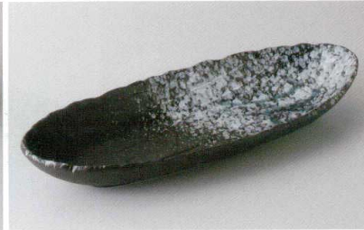
04510-276 2,100円 262704510 雪化粧楕円長大鉢 (390×158×60mm)