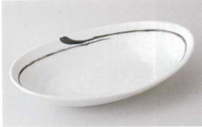
04501-166 2,250円 261604501 一筆22cm楕円皿 (221×139×36mm) 04502-166 2,550円 261604502 一筆25cm楕円皿 (253×158×42mm)