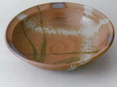
伊賀風オリベ掛段付

04915-156 530円 251524124 3.0鉢 (93×38mm) 04916-156 1,100円 251524125 4.5鉢 (146×44mm) 04917-156 2,000円 251524126 5.5鉢 (170×47mm) 04918-156 2,650円 251524127 7.0鉢 (218×54mm) 04919-156 4,450円 251524128 8.0鉢 (247×60mm)