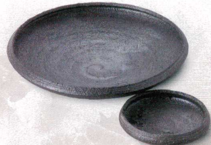
05317-456 3,750円 254501201 黒灰釉6.0鉢(手造り)(180×40mm) 05318-456 1,250円 254501202 黒灰釉丸小皿(手造り)(85×20mm)