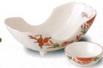
05311-216 4,000円 252100713 高麗赤絵万曆三ツ足向付(170×80×60mm) 05312-216 1,600円 252100714 高麗赤絵万曆丸千代口(65×25mm)