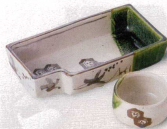
05315-216 3,800円 252100605 織部刺身鉢(170×90×45mm) 05316-216 1,400円 252100606 織部千代口(60×40mm)