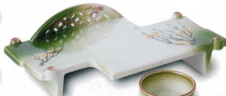
05309-186 4,000円 251800707 ハツ橋向付(250×135×80mm) 05310-186 900円 251800708 ハツ橋千代口(70×32mm)