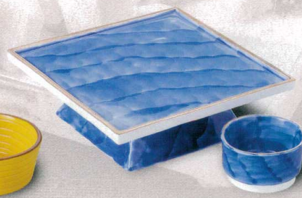
05323-336 3,500円 253300907 測金タミ高台盛皿(170×170×50mm) 05324-336 1,050円 253300908 測金タミ丸千代口(65×38mm)