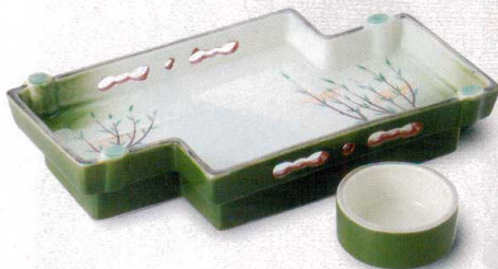
05319-186 3,750円 251800715 京橋刺身鉢(128×233×50mm) 05320-186 620円 251800716 京橋丸千代口(60×30mm)