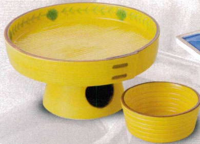
05321-186 3,650円 251800801 三方型高台刺身鉢(143×70mm) 05322-186 1,350円 251800802 三方型丸千代口(70×34mm)