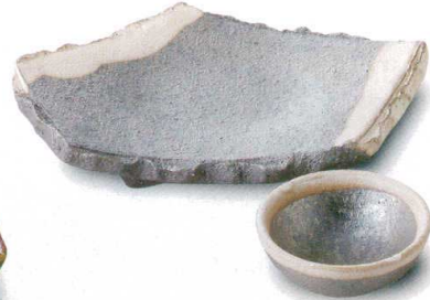
05305-436 3,500円 264305217 黒窯変掛け分け変型足付皿(210×135×30mm) 05306-436 660円 264305218 黒窯変掛け分け千代口(78×30mm)