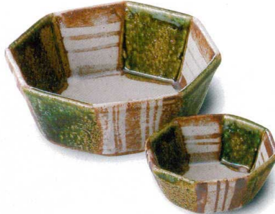
05303-086 4,000円 250801301 織部十草八角刺身鉢(130×130×50mm) 05304-086 2,000円 250801302 織部十草八角千代口(80×80×30mm)