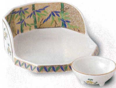
05313-186 3,950円 251800709 屏風型竹林向付(164×76mm) 05314-186 1,150円 251800710 屏風型竹林千代口(33×75mm)