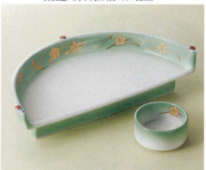
05419-416 3,200円 254101105 グリーン吹梅三ヶ月刺身鉢(125×250×55mm) 05420-416 700円 254101106 グリーン吹梅丸千代口(60×30mm)