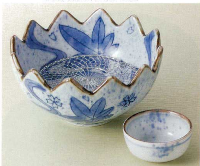
05414-086 3,300円 250801407 吹墨流水花型向付(155×85mm) 05415-086 810円 250801408 吹墨流水丸千代口(65×30mm) 05416-086 1,550円 250801409 シルバー目皿(105mm)