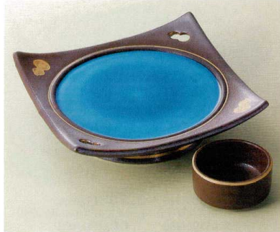
05401-086 3,400円 25080999 南蛮トルコ高台皿(170×170×50mm) 05402-086 680円 25080910 南蛮トルコ丸千代口(62×30mm)