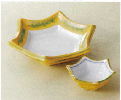
05412-236 3,300円 252301507 黄交趾六角刺身鉢(179×145×45mm) 05413-236 1,300円 252301508 黄交趾六角千代口(93×77×35mm)