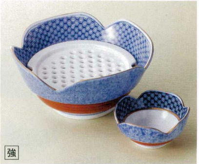
05425-316 3,200円 253101401 測七宝刺身鉢(160×80mm) 05426-316 1,400円 253101402 測七宝千代口(82×40mm) 05427-316 1,140円 253101403 測七宝さな(128mm)