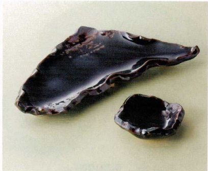
05405-076 3,400円 260705405 天目流し三角向付(270×125×38mm) 05406-076 1,050円 260705406 天目流し角千代口(79×28mm)