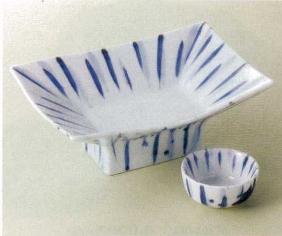
05403-306 3,400円 263005403 呉須十草長角高台向付(205×148×78mm) 05404-306 780円 263005404 呉須十草千代久(67×30mm)