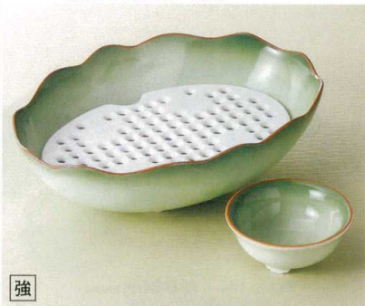
05409-316 3,350円 253101404 緑翠波測刺身鉢(215×148×65mm) 05410-316 790円 253101405 緑翠三足丸千代口(77×30mm) 05411-316 1,170円 253101406 さな(172×114×18mm)