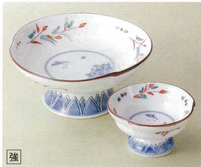
05407-086 3,350円 250801511 赤絵京山水刺身(150×70mm) 05408-086 1,250円 250801512 赤絵京山水千代口(85×50mm)