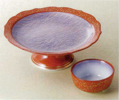
05423-336 3,200円 253300809 しずか高台向付(157×58mm) 05424-336 1,000円 253300810 しずか丸千代口(65×30mm)