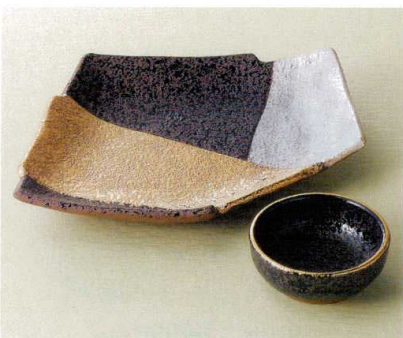
05417-456 3,200円 254500723 南蛮金銀彩結び皿(210×155×30mm) 05418-456 800円 254500724 南蛮金彩丸千代口(70×25mm)