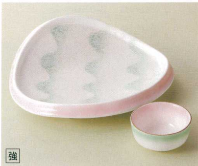
05519-336 3,000円 253301009 銀彩二色吹貝型向付(192×175×60mm) 05520-336 950円 253301010 銀彩二色吹丸千代口(65×30mm)