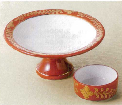
05515-186 3,050円 251800807 朱巻金彩高台向付(145×63mm) 05516-186 1,200円 251800808 朱巻金彩丸千代口(60×30mm)