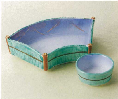
05507-186 3,150円 251801001 紫垣扇向付(183×120×45mm) 05508-186 1,150円 251801002 紫垣丸千代口(68×32mm)