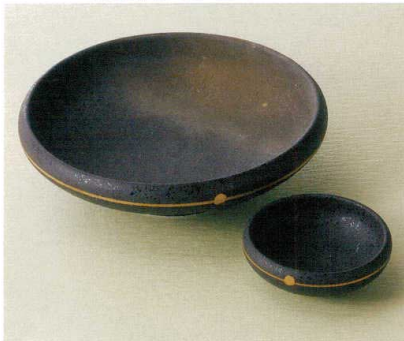
05513-186 3,100円 251801205 金彩焼締め鉄鉢向付(152×41mm) 05514-186 1,000円 251801206 金彩焼締め鉄鉢千代口(68×24mm)