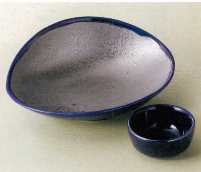
05521-236 3,000円 252201019 銀彩波千鳥刺身鉢(179×142×63mm) 05522-236 650円 252201020 銀彩波千鳥千代口(64×30mm)