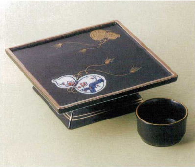
05517-336 3,050円 253300911 黒釉ひさご四角高台皿(170×170×50mm) 05518-336 850円 253300912 黒釉丸千代口(65×38mm)