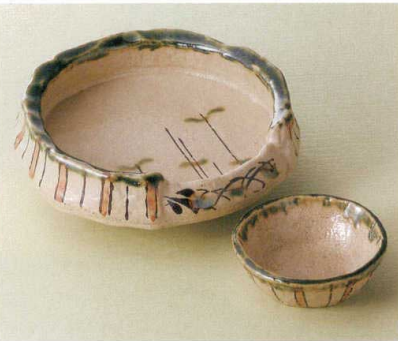
05509-306 3,100円 253001307 織部流赤十草向付(160×50mm) 05510-306 850円 253001308 織部流赤十草千代口(84×30mm)