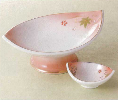
05503-336 3,200円 253301107 オレンジ吹舟型高台刺身(215×138×80mm) 05504-336 1,150円 253301108 オレンジ吹舟型千代口(90×68×35mm)