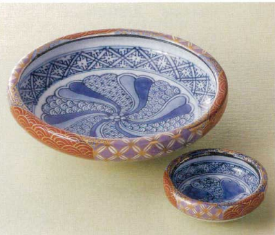
05523-186 3,000円 251801203 ネジリ祥瑞錦丸向付(153×39mm) 05524-186 1,400円 251801204 ネジリ祥瑞錦丸千代口(66×24mm)