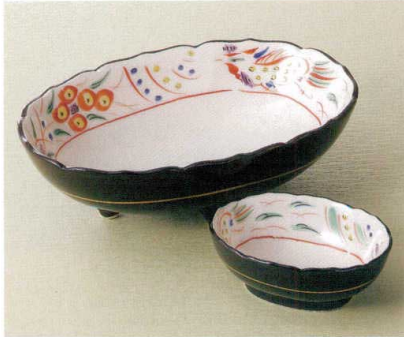
05501-186 3,200円 251801505 外黒手描赤絵向付(175×117×52mm) 05502-186 1,100円 251801506 外黒手描赤絵千代口(88×65×33mm)