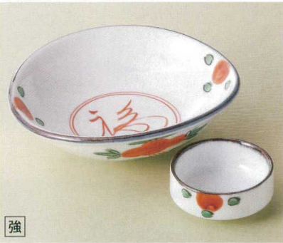
05511-086 3,100円 250801410 福の字楕円中鉢(160×147×45mm) 05512-086 1,050円 250801411 福の字丸千代口(66×28mm)