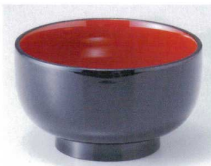
55313-566 1,150円 26565313 [A] 泉寿井 黒内朱 4.3寸 (129φ×85mm) 55314-566 1,400円 26565314 [A] 泉寿井 黒内朱 5寸 (152φ×86mm) 55315-566 1,600円 26565315 [A] 泉寿井 黒内朱 5.4寸 (163φ×90mm)