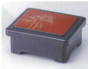
55306-566 3,720円 26565306 [TA] 耐熱錦井重 朱パール若竹内朱塗 (181×152×83mm)