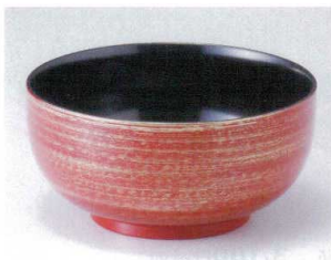
55309-566 1,550円 26565309 [A] 5寸平日野井 朱に金かすり (150φ×72mm)