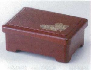
55304-566 3,620円 26565304 [A] D.X長手重 刷毛目若松内朱 (196×139×80mm)