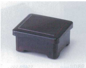
55307-566 1,350円 26565307 [A] (小)象足井重 溜内朱塗 (142×125×70mm)