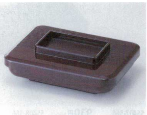
55308-566 2,070円 26565308 [A] 千筋うなぎ平 新溜内朱塗 (185×137×57mm)