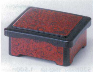
55303-566 2,800円 26565303 [A] D.X井重 朱総菊内朱天黒 (182×153×80mm)