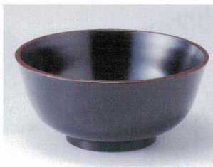
55316-566 1,300円 26565316 [A] 羽反型井 黒天うるみ 5.6寸 (170φ×85mm・890cc) 55317-566 1,820円 26565317 [A] 羽反型井 黒天うるみ 6寸 (175φ×88mm・1,250cc) 55318-566 1,970円 26565318 [A] 羽反型井 黒天うるみ 6.5寸 (195φ×90mm・1,400cc)