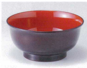
55310-566 1,720円 26565310 [TA] 5.3寸美里井椀 溜内朱 (181φ×84mm)