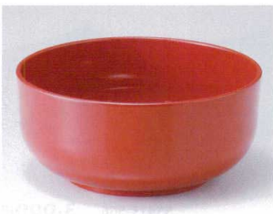
55311-566 830円 26565311 [A] 6寸多用井 洗朱 (180φ×80mm)