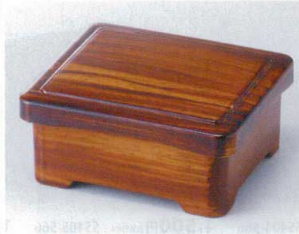
55302-566 3,100円 26565302 [A] 象足井重 紫槽内朱塗エース塗 (168×143×76mm)