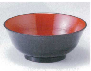
55312-566 1,100円 26565312 [TA] 6寸刷毛目羽反井 黒内朱 (185φ×77mm)