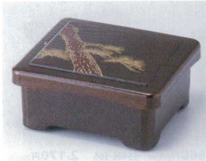
55301-566 2,020円 26565301 [A] 象足千筋井重 裂地二色松内朱塗 (168×143×78mm)