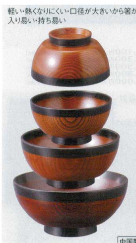
なごみ井(めん鉢) 56743-556 2,300円 56744-556 2,700円 56745-556 3,300円 56746-556 3,500円