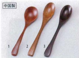
① 56701-556 300円 ② 56702-556 300円 ③ 56703-556 400円