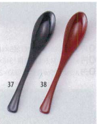
㉗ 56737-556 450円 ㉘ 56738-556 450円