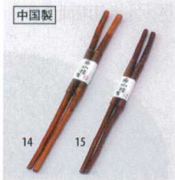
⑭ 56714-556 380円 ⑮ 56715-556 380円