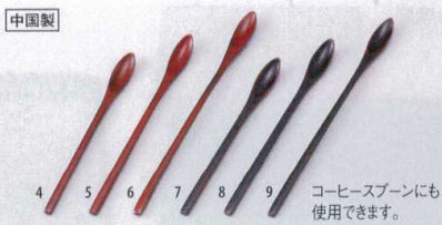
④ 56704-556 350円 ⑤ 56705-556 400円 ⑥ 56706-556 430円 ⑦ 56707-556 350円 ⑧ 56708-556 400円 ⑨ 56709-556 430円