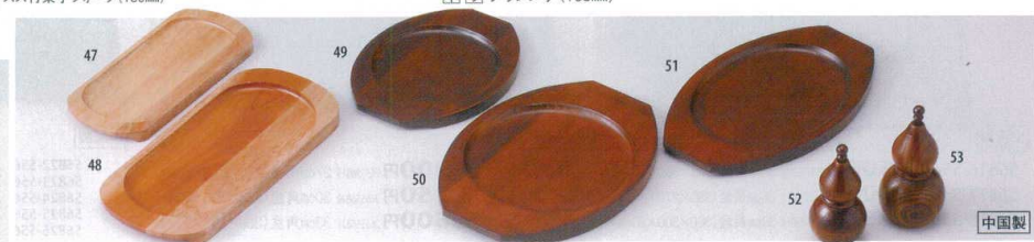
㉜ 56747-556 850円 ㉝ 56748-556 1,100円 ㉞ 56749-556 930円 ㉟ 56750-556 1,250円 ㊱ 56751-556 1,170円 ㊲ 56752-556 1,000円 ㊳ 56753-556 1,100円