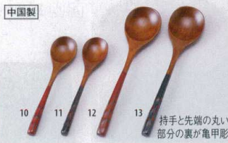
⑩ 56710-556 450円 ⑪ 56711-556 450円 ⑫ 56712-556 550円 ⑬ 56713-556 550円