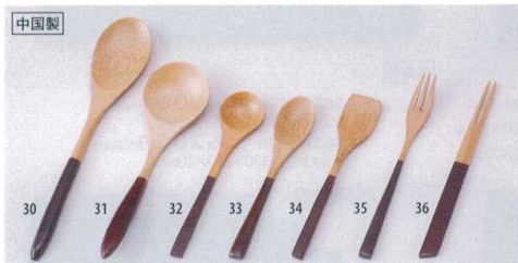
⑳ 56730-556 600円 ㉑ 56731-556 580円 ㉒ 56732-556 400円 ㉓ 56733-556 400円 ㉔ 56734-556 400円 ㉕ 56735-556 400円 ㉖ 56736-556 400円