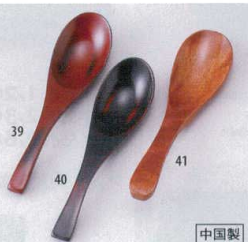
㉙ 56739-556 550円 ㉚ 56740-556 550円 ㉛ 56741-556 300円