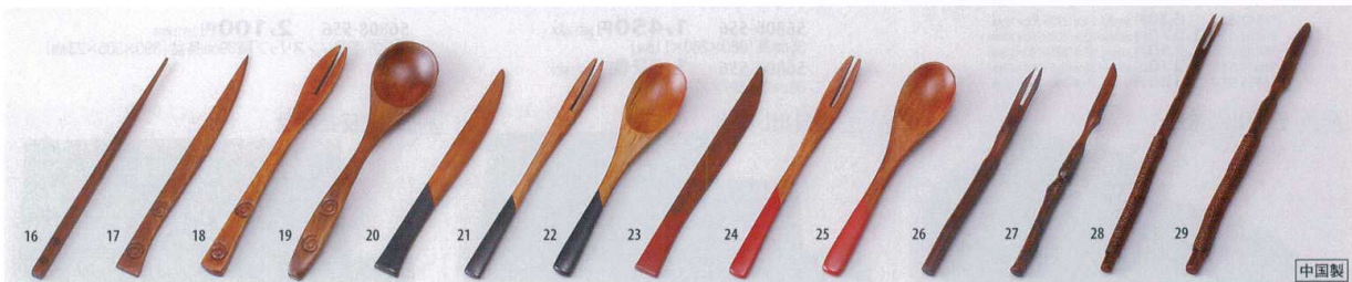
⑯ 56716-556 350円 ⑰ 56717-556 400円 ⑱ 56718-556 400円 ⑲ 56719-556 500円 ⑳ 56720-556 300円 ㉑ 56721-556 300円 ㉒ 56722-556 350円 ㉓ 56723-556 300円 ㉔ 56724-556 300円 ㉕ 56725-556 350円 ㉖ 56726-556 320円 ㉗ 56727-556 320円 ㉘ 56728-556 350円 ㉙ 56729-556 350円