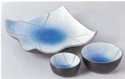
05714-306 2,700円 25300915 コハルト銀彩波角皿(175×50mm) 05715-306 830円 25300916 コハルト銀彩丸千代口(小)(67×29mm) 05716-306 1,000円 25300917 コハルト銀彩丸香水(88×40mm)