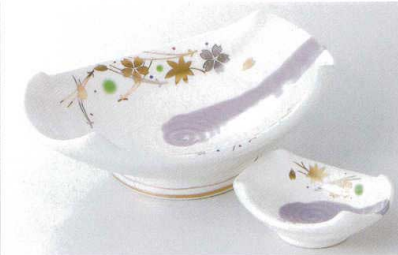
05725-336 2,700円 253301525 紫春秋舟型刺身鉢(200×140×60mm) 05726-336 950円 253301526 紫春秋舟型千代口(95×71×45mm)