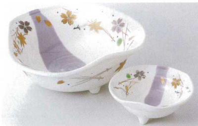
05727-336 2,700円 253301423 紫流し春秋なぶり刺身鉢(152×55mm) 05728-336 950円 253301424 紫流し春秋なぶり千代口(88×35mm)