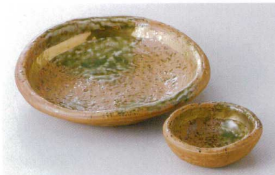
05721-336 2,700円 253301217 手造り風灰釉刺身鉢(155×35mm) 05722-336 1,250円 253301218 手造り風灰釉千代口(75×25mm)