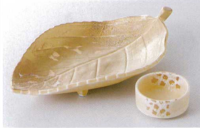
05705-336 2,800円 253301414 黄マツ金たたき木ノ葉皿(大)(250×150×50mm) 05706-336 2,400円 253301415 黄マツ金たたき木ノ葉皿(小)(205×123×50mm) 05707-336 1,000円 253301416 黄マツ金たたき丸千代口(60×30mm)