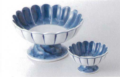
05712-186 2,700円 251800815 菊形ダミ十草高台刺身鉢(157×82mm) 05713-186 950円 251800816 菊形ダミ十草高台千代口(84×46mm)