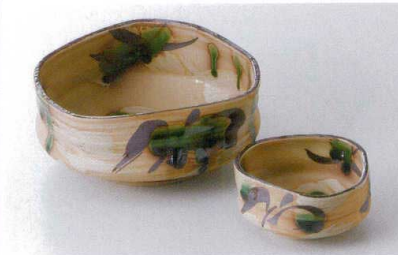
05723-126 2,700円 251201313 黄瀬戸風オリベ刺身鉢(135×58mm) 05724-126 880円 251201314 黄瀬戸風オリベ千代口(77×77×40mm)