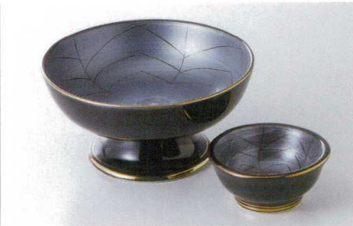
05731-186 2,650円 251800819 銀彩高台刺身鉢(150×73mm) 05732-186 930円 251800820 銀彩千代口(83×40mm)