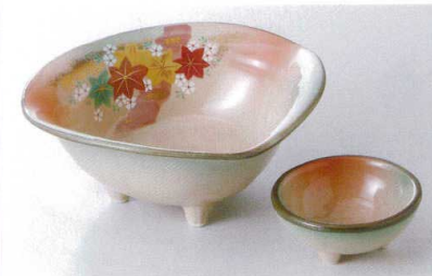
05729-226 2,660円 252201519 錦春秋三ツ足向刺身(153×60mm) 05730-226 690円 252201520 錦春秋千代口(74×30mm)