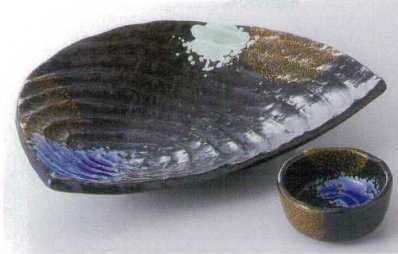
05703-236 2,800円 252301023 黒釉三色吹砂目半月向付(220×153×48mm) 05704-236 1,000円 252301024 黒釉三色吹砂目千代口(67×30mm)