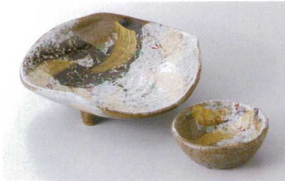
05708-226 3,190円 252201113 金彩唐津三ツ足向付(170×160×45mm) 05709-226 1,120円 252201114 金彩唐津千代口(80×26mm)