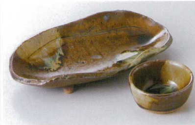
05719-186 2,700円 261805719 手造り朝鮮唐津精四ツ足向付(200×125×38mm) 05720-186 1,100円 261805720 手造り朝鮮唐津丸千代口(72×35mm)