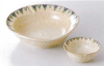
05710-186 2,750円 251801123 剣先向付(155×45mm) 05711-186 1,100円 251801124 剣先千代口(75×30mm)