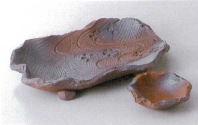
05701-076 2,800円 250701305 手造り焼ダ流水刺身皿(215×140×37mm) 05702-076 900円 250701306 手造り焼ダ丸千代口(80×20mm)