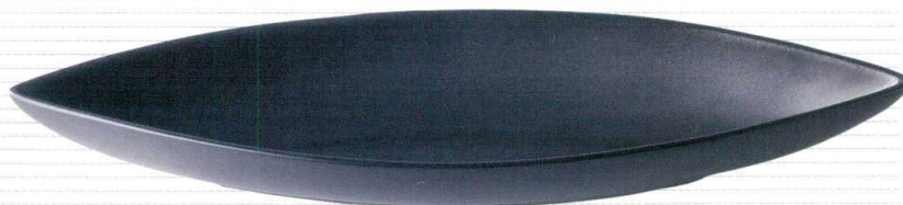
57920-026 410円 250259404 黒ヴェスルボール(小)(165×68×25mm) 57921-026 740円 250259405 黒ヴェスルボール(中)(261×89×34mm) 57922-026 1,490円 250259406 黒ヴェスルボール(大)(360×105×48mm)