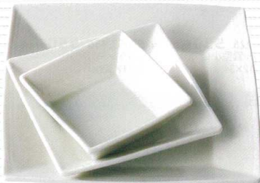
57917-336 550円 253360211 M2ホワイト角小鉢(101×101×36mm) 57918-336 750円 253360212 M2ホワイト角小皿(138×138×31mm) 57919-336 1,300円 253360213 M2ホワイト角大皿(208×208×35mm)