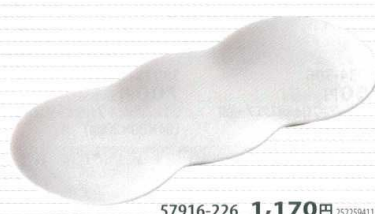
57916-226 1,170円 252259411 シュビールダンゴ型皿(97×223×16mm)