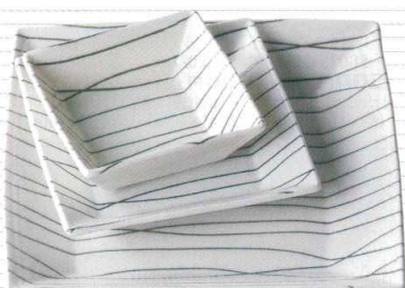
57907-336 550円 263357907 白地小枝黒線四角小鉢(101×101×36mm) 57908-336 800円 263357908 白地小枝黒線14cm角深皿(140×140×34mm) 57909-336 1,260円 263357909 白地小枝柄黒線21cm角深皿(210×210×37mm)