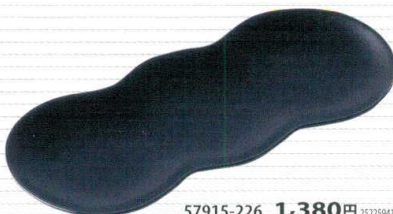
57915-226 1,380円 252259410 ダンゴ型皿黒マット(96×226×17mm)