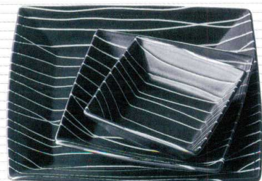
57901-336 550円 263357901 黒地小枝白線四角小鉢(101×101×36mm) 57902-336 800円 263357902 黒地小枝白線14cm角深皿(140×140×34mm) 57903-336 1,260円 263357903 黒地小枝柄白線21cm角深皿(210×210×37mm)