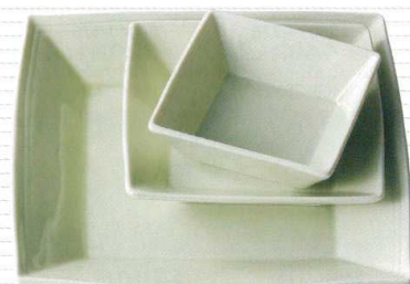
57912-336 550円 253360214 M2グリーン角小鉢(101×101×36mm) 57913-336 750円 253360215 M2グリーン角小皿(138×138×31mm) 57914-336 1,300円 253360216 M2グリーン角大皿(208×208×35mm)