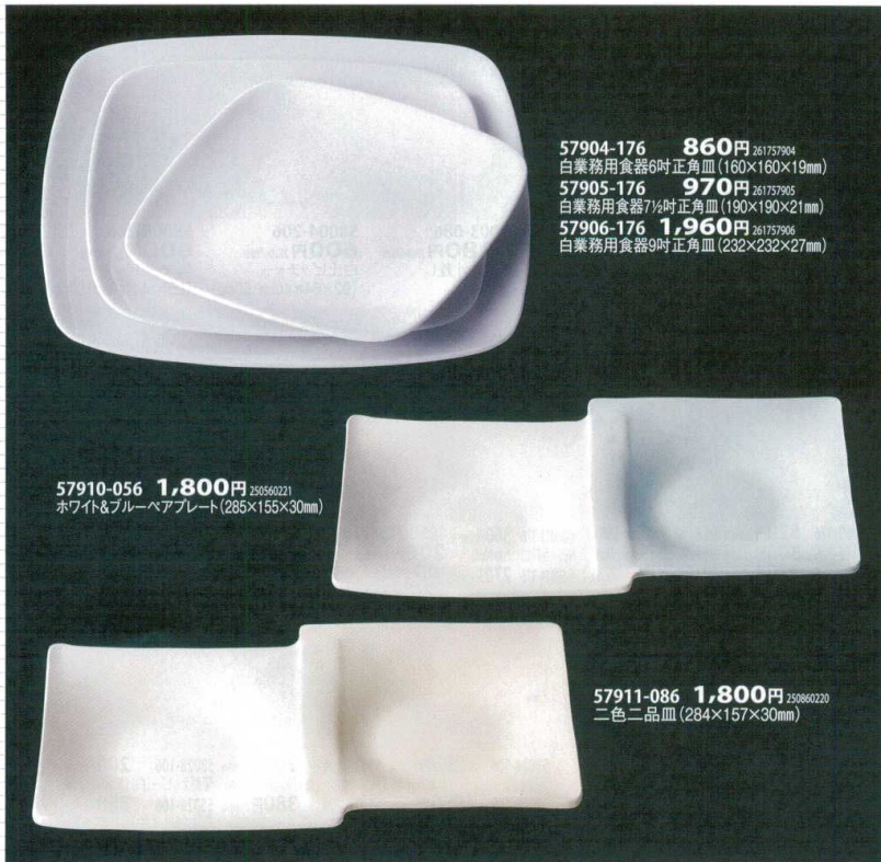
57910-056 1,800円 250560221 ホワイト&ブルーヘアプレート(285×155×30mm)