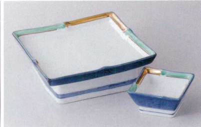
05915-186 2,400円 251801901 竹ぶし金彩刺身鉢 (150×51mm) 05916-186 850円 251801902 竹ぶし金彩千代口 (70×35mm)