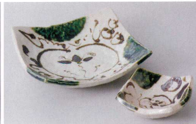
05927-126 2,300円 251200924 ベルシャ手越刺身鉢 (157×157×40mm) 05928-126 1,250円 251200925 ベルシャ手越千代口 (80×80×30mm)