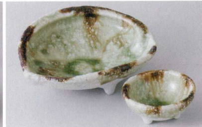
05929-186 2,300円 261805929 灰袖アワビ向付 (162×135×57mm) 05930-186 800円 261805930 灰袖アワビ丸千代口 (75×35mm)