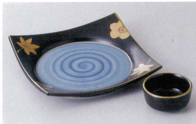
05919-186 2,350円 251800920 黒釉春秋前菜皿 (170×170mm) 05920-186 800円 251800921 黒釉春秋丸千代口 (65×30mm)