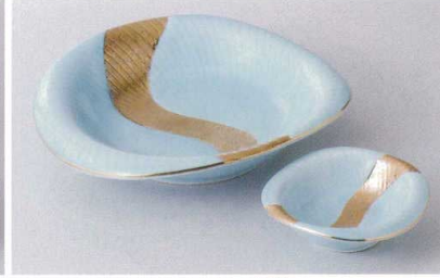
05905-186 2,400円 251801615 青白磁金彩流し刺身皿 (185×173mm) 05906-186 1,050円 251801616 青白磁金彩流し千代口 (92×83mm)