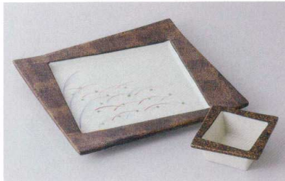
05913-186 2,400円 251800918 秋草金タタキ正角前菜皿 (180×180×17mm) 05914-186 650円 251800919 秋草金タタキ正角千代口 (67×67×28mm)