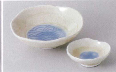
05923-286 2,350円 252801417 青海波刺身鉢 (143×48mm) 05924-286 860円 252801418 青海波千代口 (79×27mm)