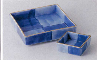
05911-126 2,400円 251201903 市松角刺身鉢 (148×148×38mm) 05912-126 980円 251201904 市松角千代口 (70×70×27mm)