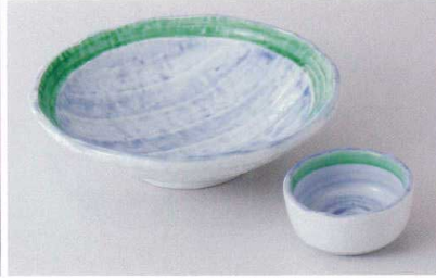
05903-186 2,400円 251801219 緑交趾ガタ彫向付 (168×48mm) 05904-186 1,150円 251801220 緑交趾ガタ彫千代口 (68×32mm)