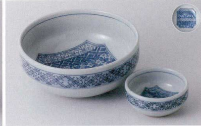
05917-416 2,350円 254101321 祥瑞花刺身鉢 (160×65mm) 05918-416 700円 254101322 祥瑞花丸千代口 (80×38mm)