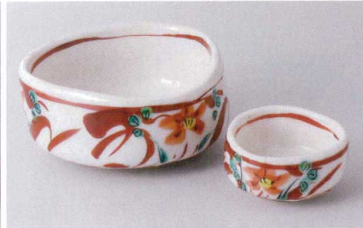
05909-456 2,400円 254501817 志野赤絵刺身鉢 (130×58mm) 05910-456 920円 254501818 志野赤絵千代口 (70×35mm)