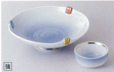
05907-076 2,400円 250701703 コバルト吹三色なぶり高台向付 (162×50mm) 05908-076 630円 250701704 コバルト吹三色丸千代口 (64×29mm)