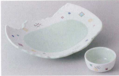
05901-186 2,400円 251801527 ジュエリーちぎり向付 (215×165×50mm) 05902-186 800円 251801528 ジュエリー丸千代口 (65×29mm)