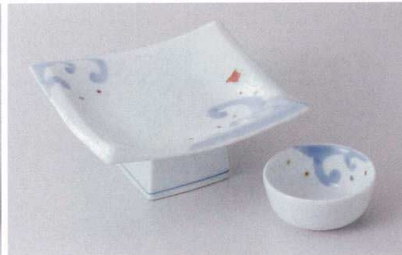
05921-186 2,350円 261805921 染錦波千鳥4.5高台皿 (135×135×65mm) 05922-186 800円 261805922 染錦波千鳥丸千代口 (67×30mm)