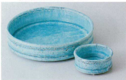
06025-036 2,200円 250301813 トルコかいらぎ切立刺身鉢(170×35mm) 06026-036 850円 250301814 トルコかいらぎ千代口(70×30mm)