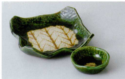
06021-286 2,200円 252801221 織部木立波角刺身鉢(150×150mm) 06022-286 820円 252801222 織部木立千代口(75×20mm)