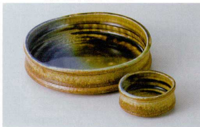
06027-036 2,200円 250301821 三彩切立5.5鉢(168×40mm) 06028-036 850円 250301822 三彩切立千代口(70×31mm)