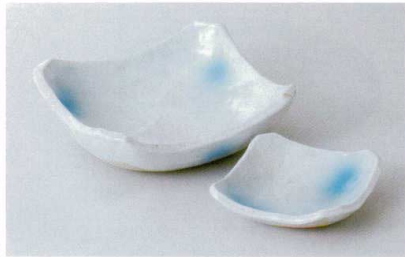
06003-416 2,300円 254101223 青粉引[正角]刺身鉢(135×45mm) 06004-416 1,000円 254101224 青粉引[正角]小皿(90×20mm)