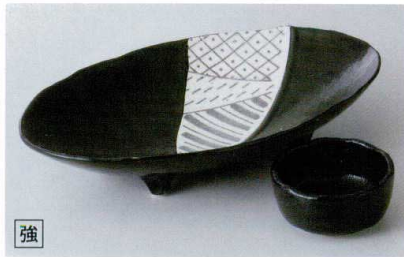
06005-286 2,300円 252801323 黒織部小判向付(215×140×40mm) 06006-286 630円 252801324 黒織部丸千代口(70×35mm)