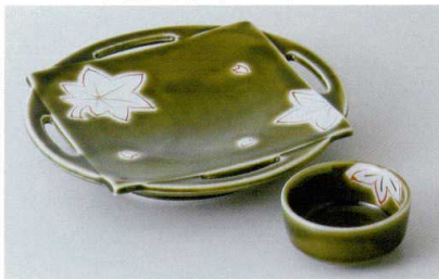
06019-186 2,200円 251801433 織部金彩紅葉スキャン高台皿(170×185×32mm) 06020-186 720円 251801434 織部金彩紅葉丸千代口(63×30mm)