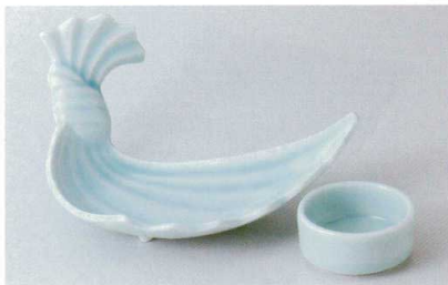
06007-186 2,300円 251801529 青白磁末広刺身皿(210×166×85mm) 06008-186 580円 251801530 青白磁末広丸千代口(62×28mm)