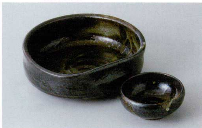
06017-456 2,200円 264506017 緑釉かいらぎ刺身鉢(5.0)(145×45mm) 06018-456 660円 264506018 緑釉かいらぎ千代口久(70×30mm)