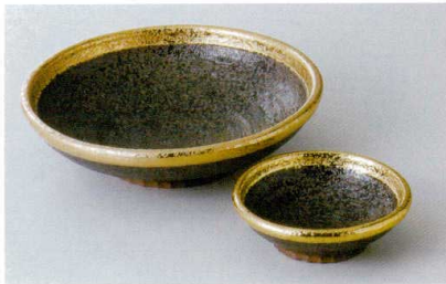
06001-456 2,300円 254501215 南蛮金彩刺身鉢(5.0)(145×40mm) 06002-456 900円 254501216 南蛮金彩丸千代口(80×25mm)