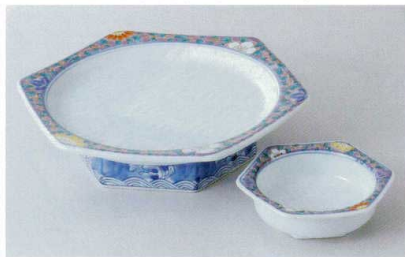
06015-186 2,250円 251801905 六角紫交趾刺身皿(190×44mm) 06016-186 700円 251801906 六角紫交趾千代口(89×28mm)