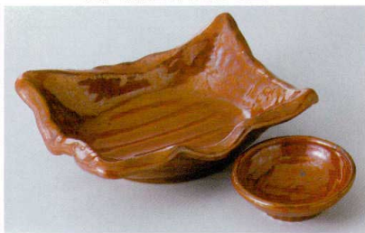
06029-316 2,200円 263106029 辰砂刺身鉢(178×145×56mm) 06030-316 540円 263106030 辰砂丸千代口(φ82×27mm)