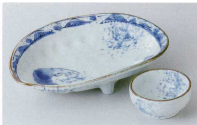
06011-126 2,250円 251201431 荒磯あわび刺身鉢(200×150×40mm) 06012-126 680円 251201432 荒磯丸千代口(70×70×35mm)