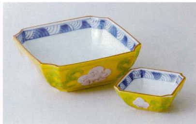
06009-286 2,250円 252801907 黄交趾唐草角刺身鉢(138×52mm) 06010-286 1,180円 252801908 黄交趾牡丹千代口(73×73×30mm)