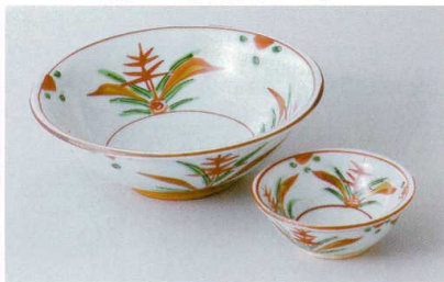
06023-186 2,200円 251801803 赤絵三方花画刺身鉢(145×50mm) 06024-186 1,200円 251801804 赤絵三方花画千代口(75×30mm)