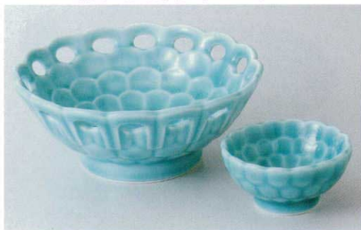
06013-136 2,250円 251301701 深海青磁刺身(153×64mm) 06014-136 800円 251301702 深海青磁千代口(77×38mm)