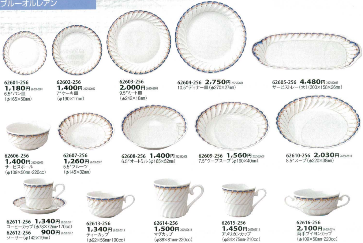
62601-256 1,180円 262562601 6.5"パン皿 (φ165×50mm)