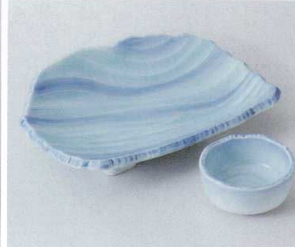
06405-076 1,450円 250701627 青磁流水刺身皿(187×138×35mm) 06406-076 800円 250701628 青磁流水丸干代口(68×31mm)