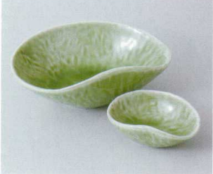
06417-036 1,350円 260306417 翡翠まゆ型向付(170×125×58mm) 06418-036 460円 260306418 翡翠まゆ型干代口(100×75×32mm)