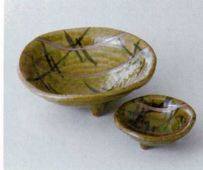
06421-136 1,330円 251302109 灰袖格子刺身(155×48mm) 06422-136 720円 251302110 灰袖格子干代口(85×30mm)