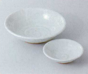
06419-036 1,350円 260306419 おふけ粉引向付(155×44mm) 06420-036 650円 260306420 おふけ粉引干代口(95×27mm)