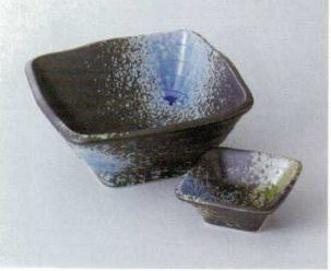
06433-176 1,280円 261706433 しぶき正角刺身鉢(155×155×65mm) 06434-176 420円 261706434 しぶき正角干代口(80×80×32mm)