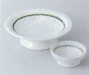
06411-036 1,400円 250301925 粉引シホリ目高台皿(166×53mm) 06412-036 350円 250301926 粉引シホリ目干代口(86×35mm)