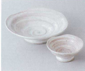
06429-306 1,300円 263006429 志野粉引高台変形刺身鉢(170×170×50mm) 06430-306 630円 263006430 志野粉引高台変形干代口(90×90×45mm)