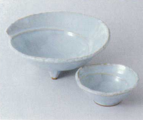
06427-026 1,310円 260206427 赤土青灰三ツ足刺身鉢(178×176×65mm) 06428-026 590円 260206428 赤土青灰干代口(102×97×40mm)