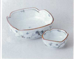
06439-316 1,260円 253102211 青磁唐草角刺身鉢(160×160×51mm) 06440-316 410円 253102212 青磁唐草角干代口(85×85×35mm)