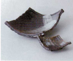
06437-126 1,270円 261206437 黒油滴白刷毛瓦向付(190×190×70mm) 06438-126 420円 261206438 黒油滴白刷毛瓦干代口(105×105×35mm)