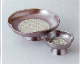
06431-276 1,300円 262706431 金彩小紋高台刺身鉢(147×142×50mm) 06432-276 480円 262706432 金彩小紋高台干代口(79×75×45mm)