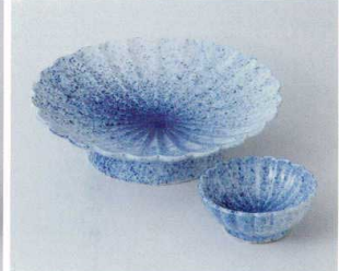
06423-056 1,320円 250501711 墨吹菊形高台皿(155×40mm) 06424-056 460円 250501712 墨吹菊形干代口(68×28mm)