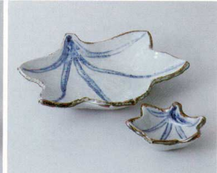
06415-456 1,380円 254501605 古染楓型刺身鉢(195×175×35mm) 06416-456 460円 254501606 古染楓型干代口(85×80×30mm)