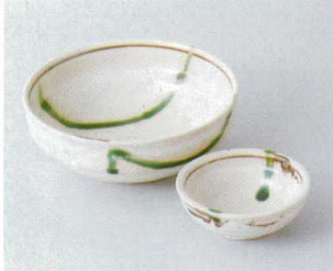
06401-406 1,500円 254001807 弥七田織部刺身鉢(127×50mm) 06402-406 720円 254001808 弥七田織部干代口(75×30mm)