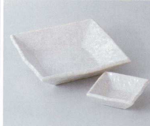
06413-266 1,400円 26206413 銀河刺身鉢(165×165×40mm) 06414-266 470円 26206414 銀河干代口(80×80×30mm)