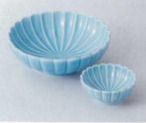
06435-406 1,280円 254002307 トルコ菊型向付(153×50mm) 06436-406 410円 254002308 トルコ菊型干代口(80×33mm)