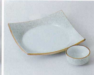
06407-186 1,400円 251801921 瀏サビグリーン吹前菜皿(170×170mm) 06408-186 560円 251801922 瀏サビグリーン吹丸干代口(65×30mm)