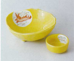
06409-076 1,400円 250701625 黄釉赤絵うさぎ三ツ足向付(140×137×50mm) 06410-076 720円 250701626 黄釉赤絵うさぎ丸干代口(62×30mm)