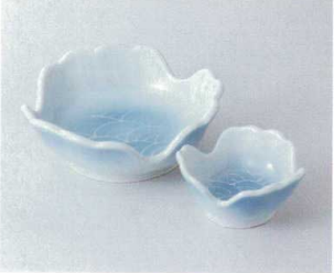
06425-316 1,320円 253101721 白波三葉5.0刺身鉢(143×50mm) 06426-316 380円 253101722 白波三葉3.0干代口(90×41mm)