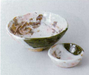
06403-136 1,480円 251301709 オリベ古木刺身(150×60mm) 06404-136 820円 251301710 オリベ古木干代口(82×30mm)