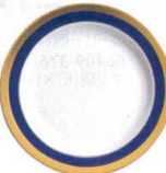
66302-026 1,730円 250267302 7½吋ケーキ皿 (197×20mm)