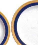
66304-026 4,060円 250267304 10吋ミート皿 (272×30mm)