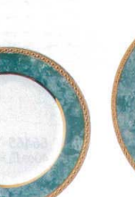
66363-026 1,130円 260266363 9吋ミート皿 (240×21mm)