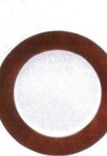
66323-026 1,200円 260266323 玉淵9吋ミート皿 (237×24mm)