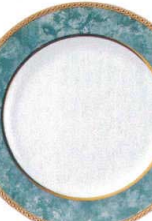
66364-026 1,850円 260266364 10吋ミート皿 (264×24mm)