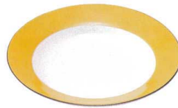
66346-026 1,260円 260266346 玉淵9吋スープ(235×42mm)