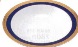
66307-026 1,780円 250267307 8吋スープ(212×40mm)