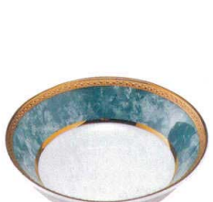
66365-026 630円 260266365 5吋ボール (135×40mm)