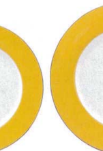
66345-026 3,580円 260266345 玉淵12吋ミート皿 (304×28mm)