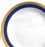
66303-026 2,570円 250267303 9吋ミート皿 (238×28mm)