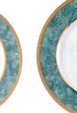
66365-026 630円 260266365 5吋ボール (135×40mm)