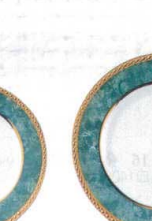
66362-026 840円 260266362 7½吋ケーキ皿 (194×16mm)