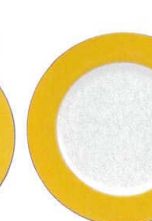
66344-026 1,790円 260266344 玉淵10吋ミート皿 (265×22mm)