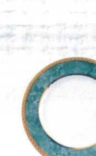
66361-026 630円 260266361 6吋パン皿 (164×15mm)