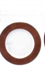
66322-026 870円 260266322 玉淵7½吋ケーキ皿(192×18mm)