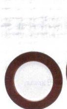
66321-026 750円 260266321 玉淵6吋パン皿(160×15mm)