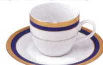
66308-026 3,500円 250267308 コーヒーC/S(74×65mm・180cc)