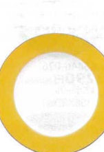
66343-026 1,200円 260266343 玉淵9吋ミート皿 (237×24mm)