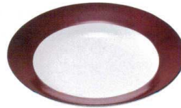
66326-026 1,260円 260266326 玉淵9吋スープ(235×42mm)