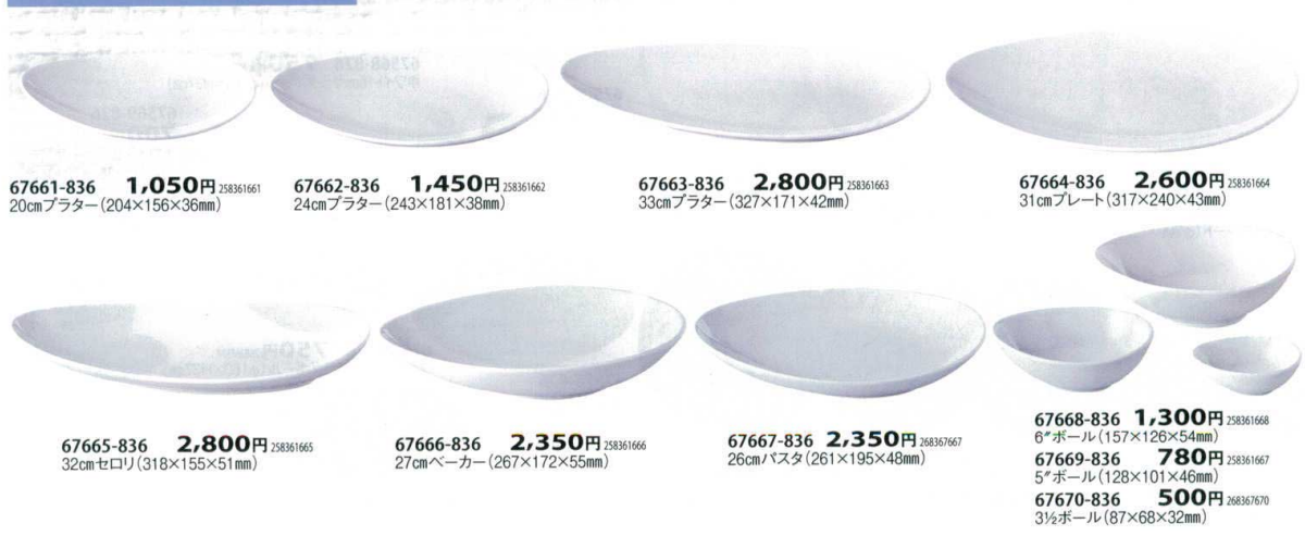
67661-836 1,050円 258361661 20cmプラター (204×156×36mm)