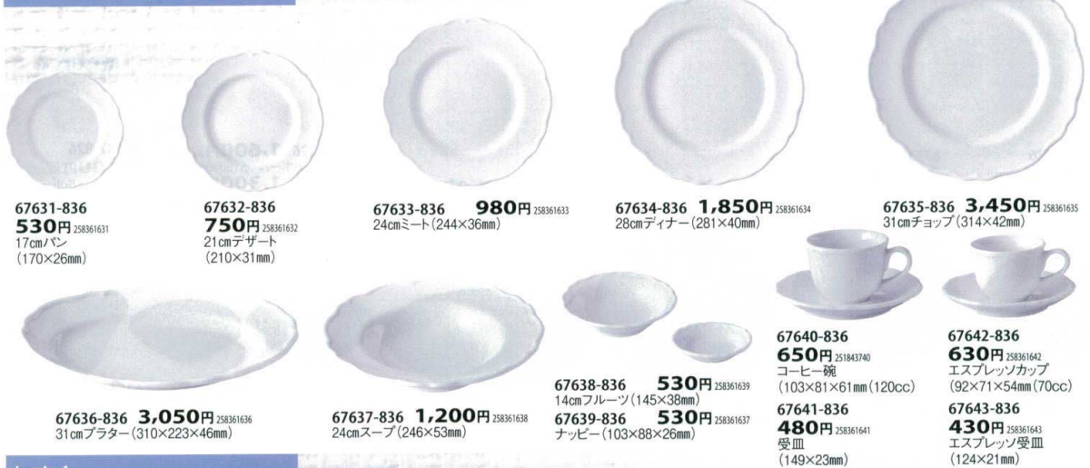
67631-836 530円 258361631 17cmパン (170×26mm)