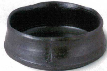
06907-226 4,790円 262206907 黒陶吹とら鉢(155×67mm)