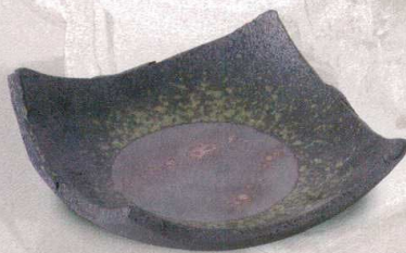
06915-436 4,000円 254302701 炭化四角そり皿(150×150×40mm)