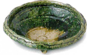
06903-126 5,000円 261206903 織部三ツ足丸鉢(手造り)(19.3×18×6mm)