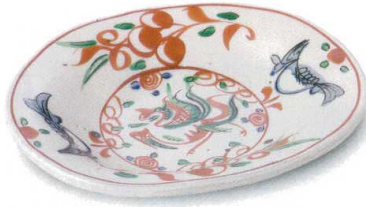
06902-086 5,200円 250802508 粉引花鳥楕円皿(192×162×35mm)