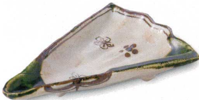
06908-306 4,600円 253002507 織部扇面向付(195×180×35mm)