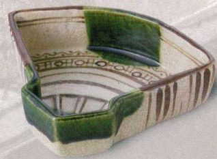
06916-456 4,000円 254502510 織部扇面向付(150×125×45mm)