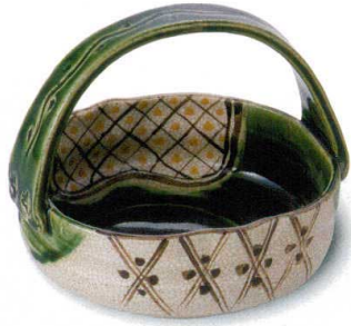
06901-456 5,400円 254502601 織部手付鉢(手造り)(160×130mm)