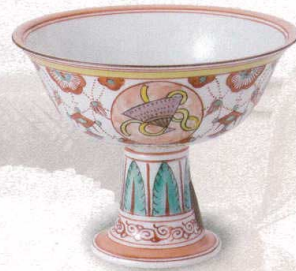
06913-186 4,100円 251803002 瑛瑠高台向付(127×103mm)