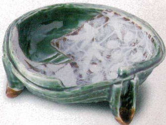
06914-186 4,000円 261806914 オリベ草花6寸三ツ足盛鉢(190×178×75mm)