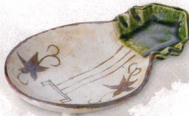
06912-126 4,400円 251202513 オリベびわ形向付(200×130×33mm)