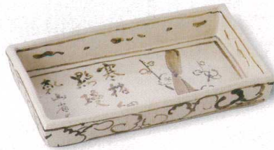
06909-406 4,500円 264006909 乾山風長角鉢(185×1110×35mm)