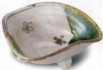
06911-126 4,400円 251202506 織部鉄仙三ツ足向付(160×160×64mm)