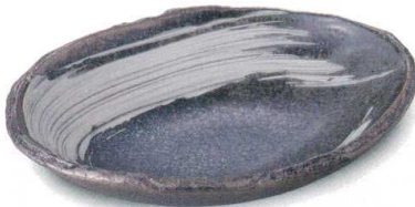
06904-436 3,200円 254315405 刷毛目5.5楕円皿(小)(165×130×35mm) 06905-436 4,800円 254315406 刷毛目7.0楕円皿(中)(205×150×40mm)