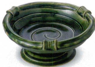
06906-186 4,800円 251803702 手造り織部くし目高台向付(150×60mm)