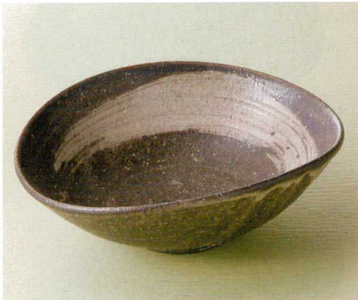
07004-436 3,850円 254316005 灰釉刷毛目楕円鉢(185×165×60mm)