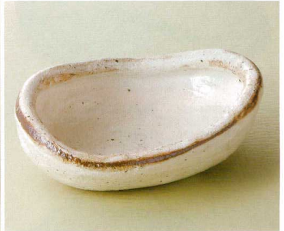
07006-436 3,850円 254302702 刷荒粉引5.5楕円鉢(165×140×55mm)