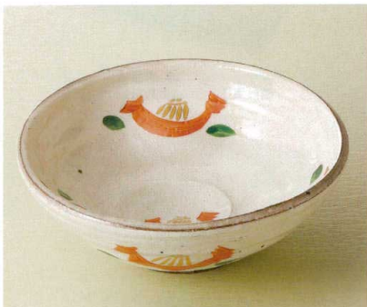
07007-056 3,800円 260507007 粉引赤絵花中鉢(手造り)(160×60mm)