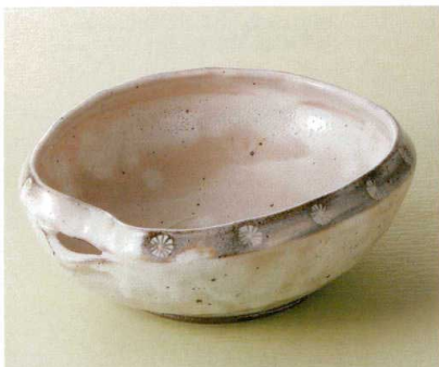
07010-456 3,600円 254523101 三島手6.0片口鉢(手造り)(180×165×60mm)