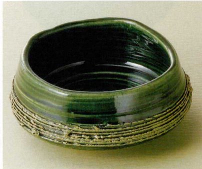
07005-186 3,850円 251803604 ヒタ織部向付(165×165×60mm)