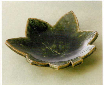
07009-126 3,600円 251202707 織部紅葉皿(185×180×35mm)