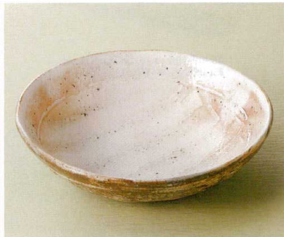
07008-436 3,650円 254302703 荒土しのぎ手5.5丸鉢(160×40mm)