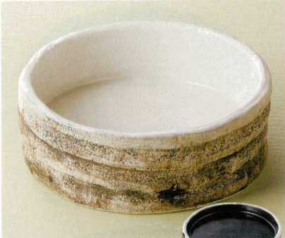
07001-086 4,000円 250802606 黒白台皿(140×52mm)