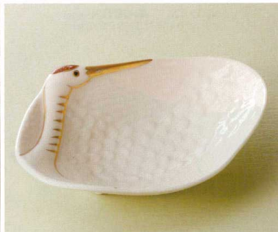
07011-406 3,500円 254002801 高麗鶴型向付(180×140×43mm)