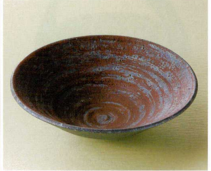
07003-436 3,980円 264307003 暁刷毛目向付(177×60mm)