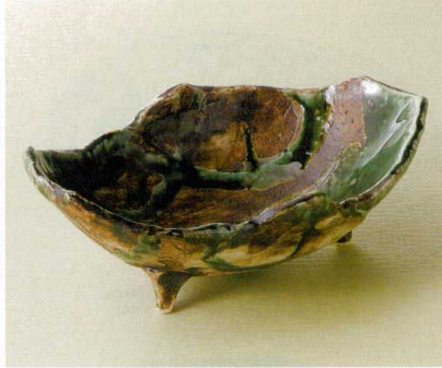
07002-086 4,000円 260807002 織部やぶれ三ツ足舟型鉢(205×150×80mm)