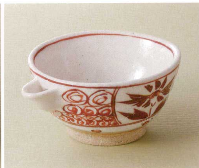
07111-216 3,200円 252103606 粉引赤絵花片口中鉢 (150×128×70mm)