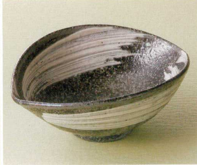
07102-436 3,400円 254304409 刷毛目あみがさ小鉢 (150×130×60mm)