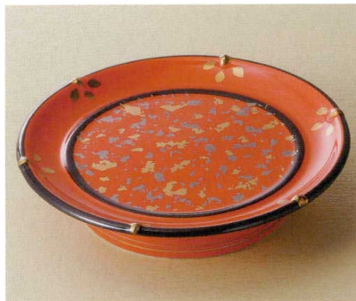
07107-306 3,200円 253003004 赤釉鼓型高台6.0皿 (180×37mm)