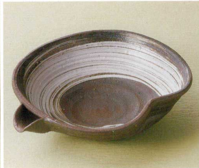
07105-436 3,300円 254302706 炭化刷毛目片口向付 (175×155×40mm)