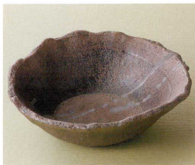
07110-436 3,200円 254303605 炭化ポタモチ6.0楕円鉢 (180×165×55mm)