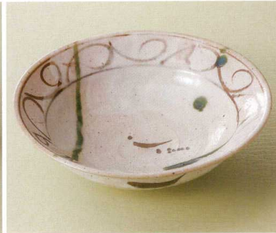
07109-406 3,200円 254003608 弥七田織部平向付 (168×42mm)