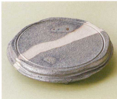
07104-436 3,300円 254302604 黒窯変掛け分け5.7足付丸皿 (172×172×30mm)