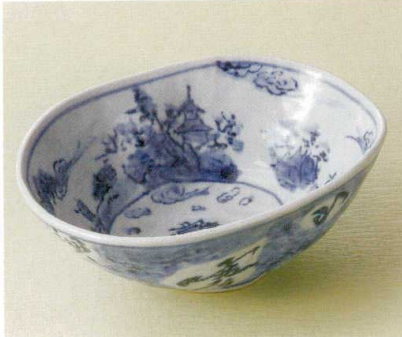
07101-336 3,450円 253302901 御深井山水向付 (180×136×70mm)