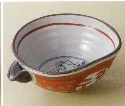
07112-086 3,100円 250803006 片口外赤巻福祿寿鉢 (170×140×70mm)