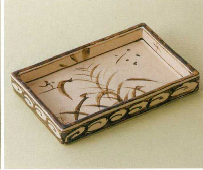
07103-126 3,400円 351202608 乾山風蘭6.0長角皿 (183×120×25mm)