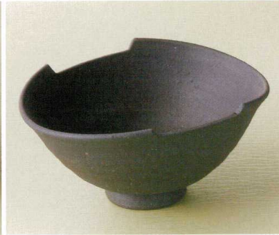
07106-436 3,300円 254302705 炭化筆かえし中鉢 (155×120×70mm)