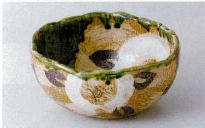
07407-136 2,600円 251323008 織部白椿ぶりぶり鉢(170×160×85mm)