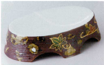
07411-186 2,600円 261807411 金流水楕円高台向付(195×134×47mm)