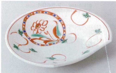
07406-186 2,650円 251803009 半月赤絵菊皿(190×160mm)