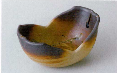
07403-306 2,700円 253004608 焼締双葉型小鉢(150×106×70mm)