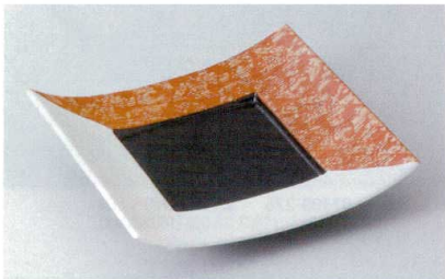
07410-086 2,600円 260807410 半掛錆正角皿(165×165×37mm)