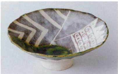
07415-036 2,500円 250302611 ピカソ志野織部5.5浅鉢(170×160×62mm)