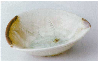
07413-406 2,550円 254002903 灰釉浅鉢(160×155×50mm)