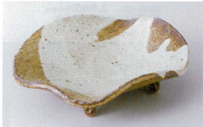
07405-226 2,660円 262207405 カライギミツ足刺身(178×160×45mm)