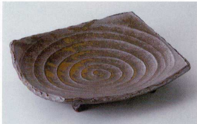
07408-126 2,600円 261207408 灰釉四ツ足角皿(大)(185×185×43mm)