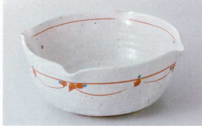
07402-126 2,700円 251223007 赤絵四ツ押5.5鉢(手造)(170×170×65mm)