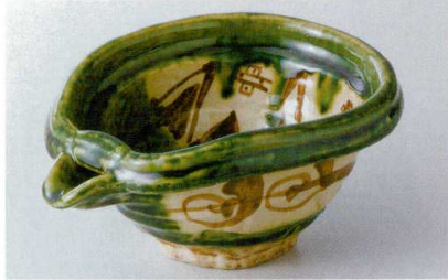
07401-476 2,700円 254703707 織部片口6.0中鉢(180×135×90mm)