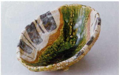
07414-086 2,550円 250802610 織部かまくら型向付サビ十草付(182×155×88mm)