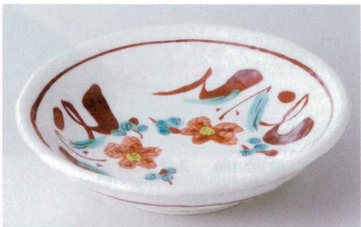
07412-456 2,600円 254523105 志野赤絵6.0深皿(190×45mm)