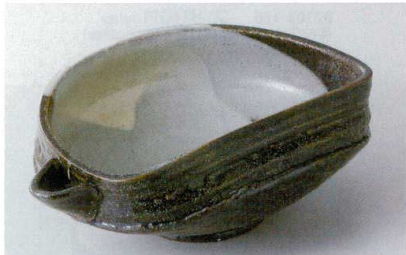
07404-126 2,700円 251203007 魯山人片口向付(165×135×155mm)