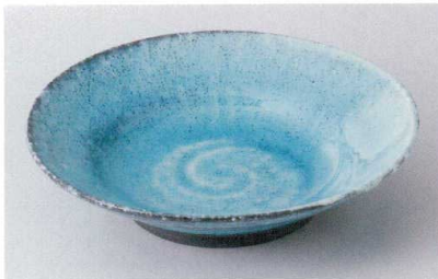
07904-036 1,450円 250303909 トルコかいいらぎ4.5浅鉢(135×33mm) 07905-036 1,900円 250303910 トルコかいいらぎ5.5浅鉢(170×38mm)