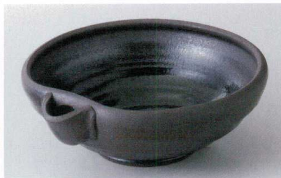
07915-186 1,800円 251804202 黒陶吹片口5.0鉢(165×153×57mm)