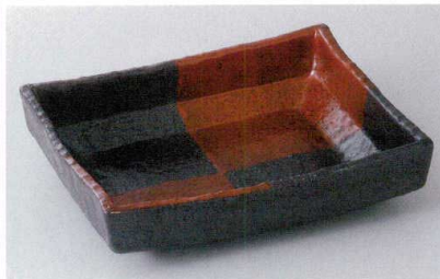
07912-186 1,800円 261807912 暁市松長角鉢(190×155×50mm)