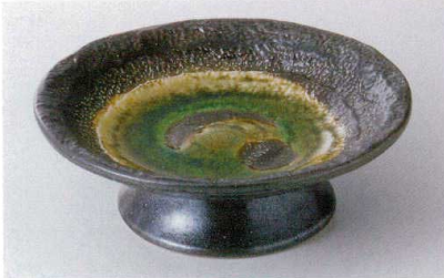
07901-036 1,900円 250303904 窯変灰釉6.0高台鉢(192×192×65mm)