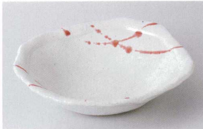
07906-286 1,890円 253803206 辰砂ちらし平皿(手起)(185×50mm)