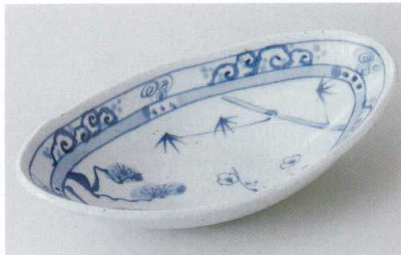
07913-126 1,800円 261207913 染付松竹梅向付(214×124×46mm)