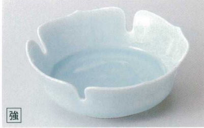
07903-186 1,900円 251802408 青白磁四ツ切双魚向付(155×155×52mm)