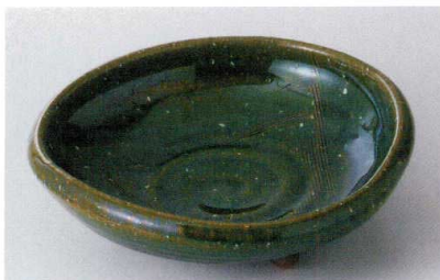
07914-126 1,800円 261207914 織部三ツ足向付(手造り)(150×48mm)