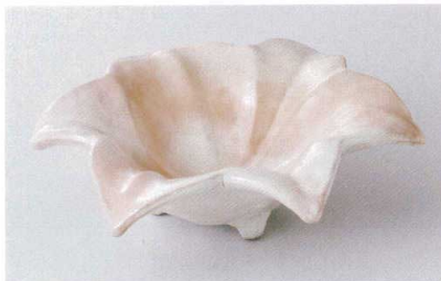
07908-456 1,850円 254503911 粉引ゆり型中鉢(175×130×50mm)