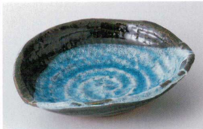
07909-406 1,850円 254002914 トルコかいいらぎ5.0鉢(178×163×45mm)