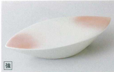
07910-316 1,810円 263107910 あけぼの多用皿(235×120×38mm)