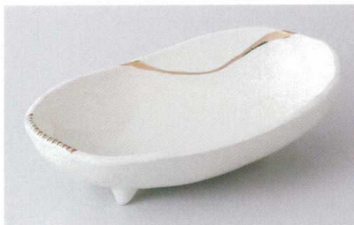
07911-316 1,810円 253103107 月と川舟型向付(180×115×40mm)