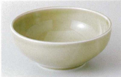
07907-236 1,850円 25323015 ヒワ釉5.0ボール(165×65mm)