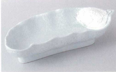
07902-326 1,900円 263207902 真珠双葉向付(230×100×48mm)