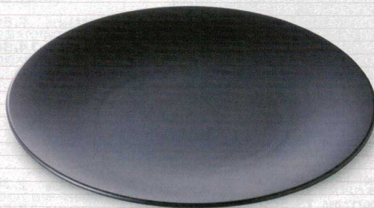
00812-126 8,500円 251220206 黒マット尺2大皿(380×45mm)