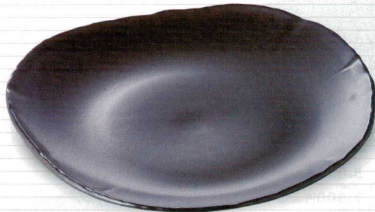
00801-176 13,200円 261700801 黒マット三方皿(418×390×60mm)