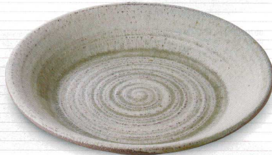
00805-436 4,500円 254320207 古窯9.0皿鉢(270×43mm) 00806-436 7,000円 254320208 古窯11.0皿鉢(335×50mm) 00807-436 10,000円 254320209 古窯13.0皿鉢(390×60mm)