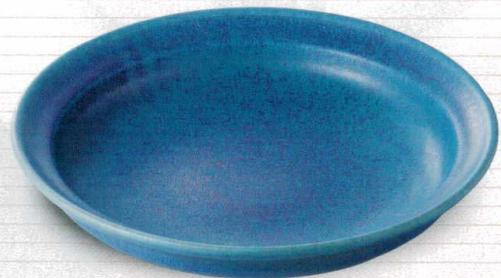
00809-436 9,800円 254319602 トルコ青11.0丸皿(335×65mm)