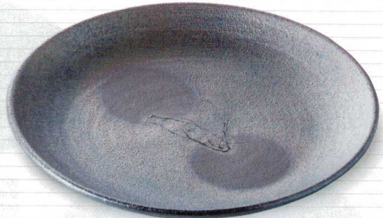
00802-436 6,800円 264300802 黒窯変11.0ポタモチ丸皿(330×40mm) 00803-436 12,000円 264300803 黒窯変13.0ポタモチ丸皿(390×50mm)