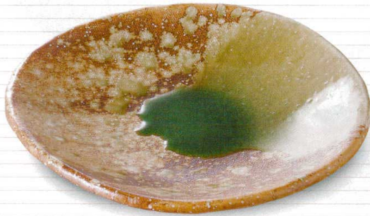
00804-436 10,450円 254320202 灰釉11.0丸皿(340×35mm)