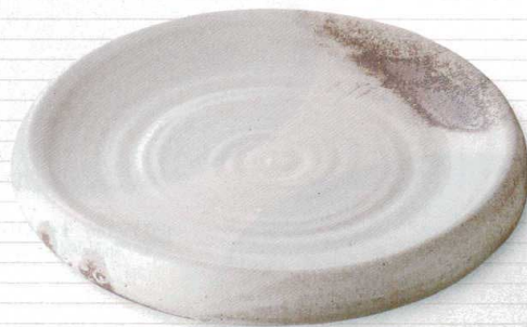
00808-436 9,800円 264300808 灰釉粉引10.0台皿(315×35mm)