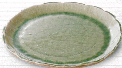
00810-436 4,900円 254320304 蒔黄10.0丸皿(300×25mm) 00811-436 9,680円 254320305 蒔黄12.0丸皿(360×30mm)