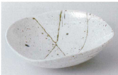
08012-226 1,700円 262208012 オアシス平鉢 (182×52mm)