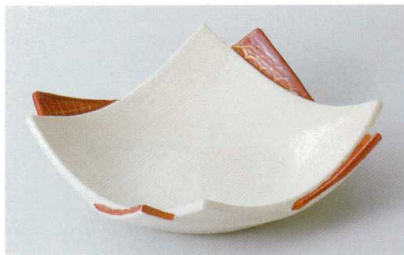
08005-326 1,760円 263203810 赤絵重ね皿(中) (155×155×45mm)