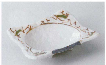
08013-076 1,700円 250703202 志野文字角向付 (160×144×47mm)