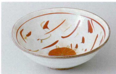
08009-406 1,750円 254003814 赤絵金彩浅鉢 (145×52mm)