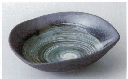
08017-226 1,700円 252203906 窯変刷毛目緑 (183×50mm)