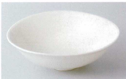
08014-036 1,250円 250304105 黄土粉引ゆるり小ボール (124×55mm) 08015-036 1,700円 250304106 黄土粉引ゆるりボール (165×55mm)