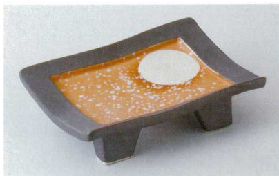
08008-076 1,750円 250702808 黒土萬月5寸向付 (157×110×45mm)