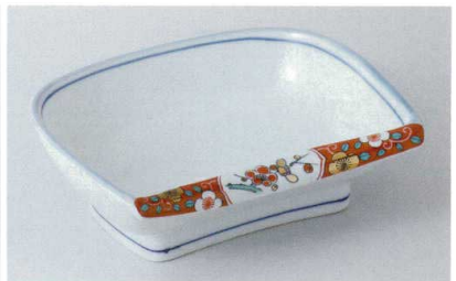
08007-316 1,760円 263101707 錦梅半月鉢 (170×145×55mm)