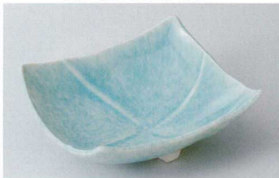
08006-026 1,760円 260208006 青磁かや折目足付向付 (157×148×56mm)