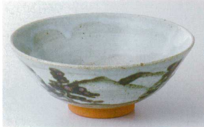
08001-476 1,800円 264708001 唐津山水平型鉢 (140×55mm)