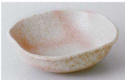
08016-316 1,700円 263108016 あかつき撫角鉢 (143×143×48mm)