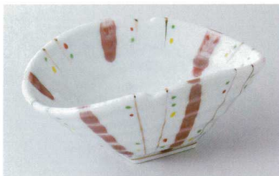
08011-186 1,750円 251805308 釉裏紅水玉十草変形小鉢 (152×112×63mm)