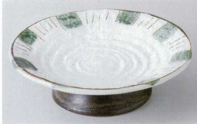
08002-036 1,400円 269308002 織部十草高台5.0皿 (163×45mm) 08003-036 1,800円 269308003 織部十草高台6.0皿 (195×53mm)