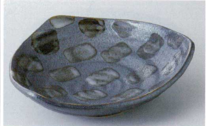
08004-316 1,780円 263108004 黒斑点三角鉢 (200×182×50mm)