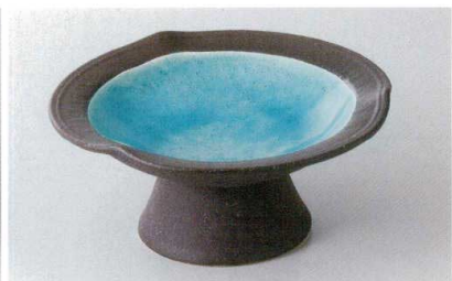
08113-056 920円 250502805 トルコ高台4.5皿 (130×55mm) 08114-056 1,620円 250502806 トルコ高台5.5皿 (165×75mm)