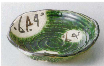
08115-306 1,600円 253003207 織部錆絵向付 (173×166×40mm)