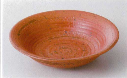
08103-036 1,700円 260308103 朱釉5.0平鉢 (164×38mm)