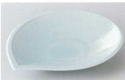
08112-216 1,650円 252103409 青白磁しずくフルーツ皿 (205×175×33mm)