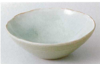
08116-156 860円 251524947 白雲盛り鉢(小) (130×127×54mm) 08117-156 1,600円 251524948 白雲盛り鉢(中) (166×56mm)