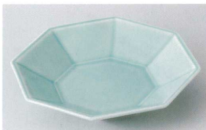
08111-126 1,650円 251203410 深海青磁6.0八角皿 (180×35mm)