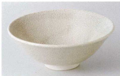
08108-476 1,650円 264708108 墨入貫入平型鉢 (145×55mm)