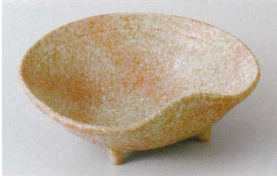
08102-316 1,700円 263108102 あかつき片押向付 (150×135×54mm)