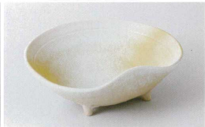
08110-326 1,650円 263208110 山吹片押5.0鉢 (150×135×52mm)