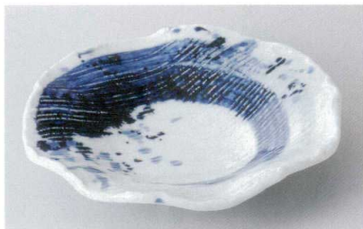
08104-056 1,680円 250503302 ゴス刷毛6.0深皿 (180×35mm)