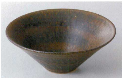
08109-086 1,650円 250803714 紺窯変浅ボール (162×61mm)