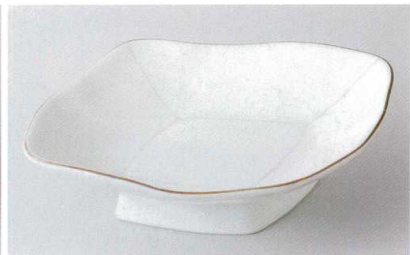
08106-056 1,270円 260508106 和白菱中皿 (155×150×48mm) 08107-056 1,670円 260508107 和白菱大皿 (190×185×55mm)