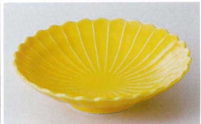
08215-186 1,500円 251803209 黄磁菊型5.3皿 (162×40mm)