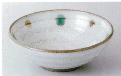
08213-036 1,500円 250304107 かいらぎ水玉5.0鉢 (154×56mm)