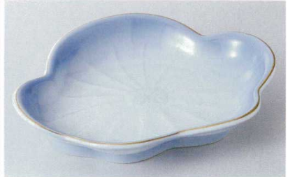
08203-186 1,600円 251802809 潤金コバルト梅型刺身皿 (205×165mm)