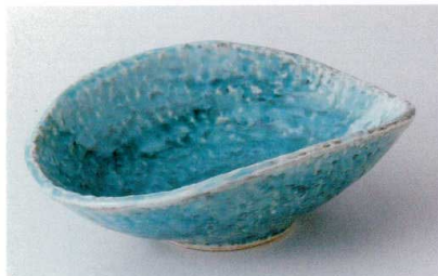
08207-056 1,580円 250503412 緑トルコ楕円鉢 (168×130×53mm)