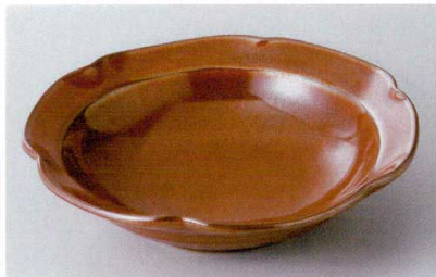
08208-316 1,580円 263108208 紅結晶花型6.0鉢 (φ177×43mm)