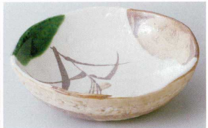
08209-186 1,550円 251823016 すずき志野タタラ鉢 (187×52mm)