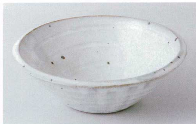
08214-036 1,500円 250304019 粉引鉄華潤厚中鉢 (156×52mm)