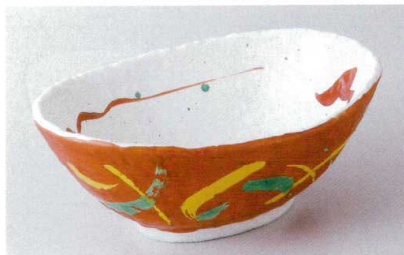
08204-186 1,600円 251803919 朱巻武蔵野精円鉢 (172×122×67mm)