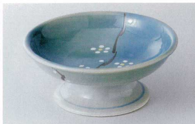
08211-056 1,550円 250501923 白梅高台鉢 (153×63mm)