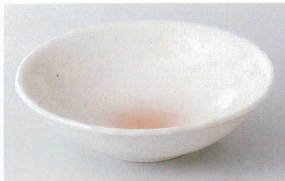
08205-156 1,600円 251504206 あけぼの5.5鉢 (165×48mm)