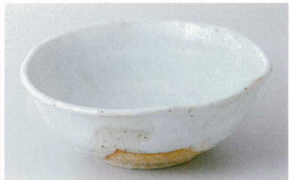
08206-326 1,600円 253223014 ゆらりサラダ鉢 (175×64mm)