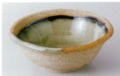
08210-326 1,550円 253203907 まりも5.0玉鉢 (160×155×61mm)