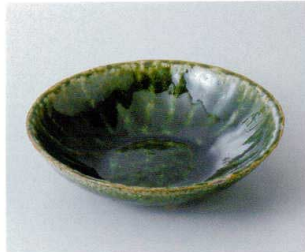
08401-166 1,300円 261608401 総織部向付 (165×40mm)