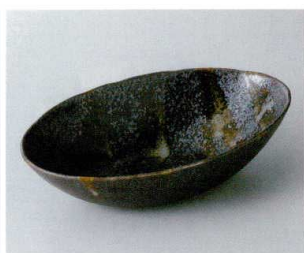
08414-206 1,200円 262008414 窯変いぶし白振り楕圓中鉢 (220×140×50mm)