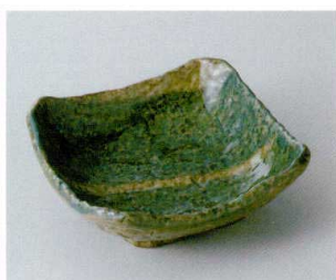
08416-476 1,200円 264708416 緑彩貫入5.0角鉢 (135×50mm)