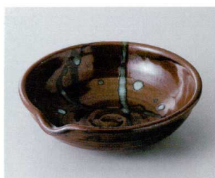
08413-416 1,200円 254103214 鉄釉片口5.0鉢 (150×45mm)