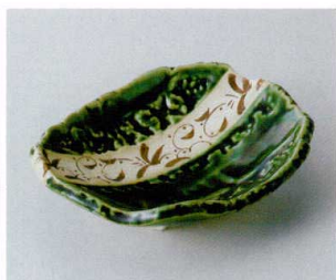
08412-056 1,200円 250505405 織部唐草4.0平鉢 (160×135×43mm)