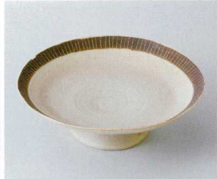
08402-056 1,300円 260508402 モダン十草高台皿 (150×48mm)