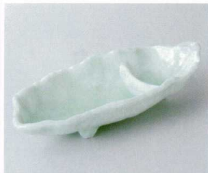
08408-286 1,260円 252815215 もえぎハーモニー鉢 (220×100mm)