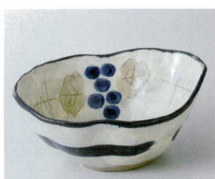
08418-056 1,150円 250504111 ぶどう変形鉢 (170×145×65mm)