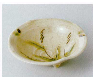
08420-156 640円 251507029 黄瀬戸スキ三ツ足3.6小鉢 (114×36mm) 08421-156 1,150円 251507030 黄瀬戸スキ三ツ足5.0鉢 (155×46mm)