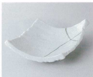
08411-306 1,250円 253003307 グリン筋刺身皿 (260×210×70mm)