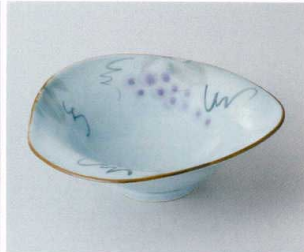
08404-186 1,300円 251803212 手書きぶどうなぶり向付 (156×152×53mm)