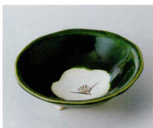
08415-476 1,200円 264708415 織部椿三ツ足平鉢 (150×45mm)