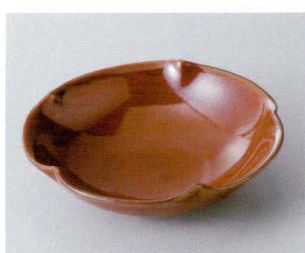
08417-316 1,180円 263108417 紅結晶花型5.5鉢 (φ151×43mm)