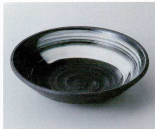
08406-126 1,300円 261208406 黒釉白刷毛6.0鉢 (190×50mm)