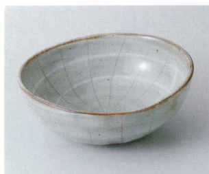
08409-206 1,250円 262004112 唐津線引き楕圓鉢(中) (158×150×60mm)