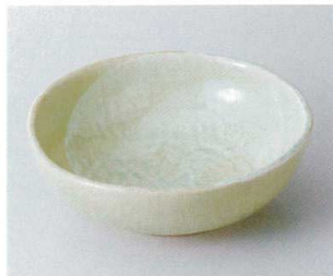
08405-156 1,300円 251504120 手造り風5.0鉢よもぎ (170×162×55mm)