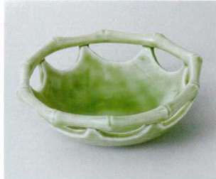
08403-126 2,150円 261208403 ヒスイ若竹鉢 (192×180×53mm)