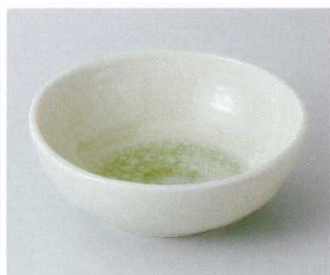
08410-156 1,250円 251504115 オフケ若草5.0鉢 (153×55mm)