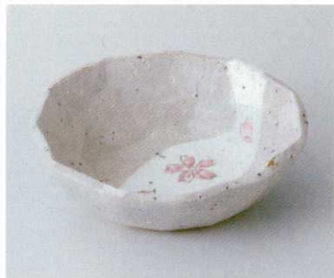
08407-066 1,280円 260608407 桜花5.0鉢 (165×160×50mm)