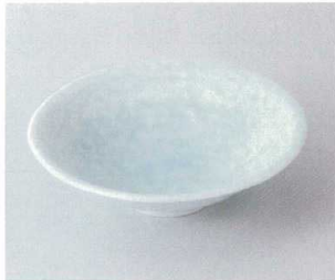
08619-056 880円 260508619 青白磁岩清水向付 (150×50mm)