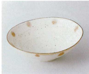
08610-166 950円 261608610 寿々5.8浅鉢 (171×160×52mm)