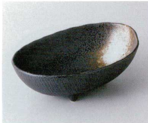
08618-076 880円 260708618 黒白吹精円三ツ足中鉢 (194×131×60mm)