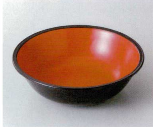
08602-336 1,000円 263308602 ジャパネスクサラダボール (179×50mm)