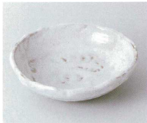
08605-316 980円 263108605 手造り風志野5.5多用鉢 (170×165×47mm)