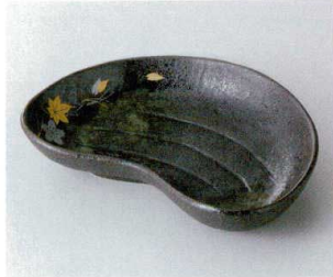
08601-166 1,000円 251603306 伊賀春秋変形皿 (210×150×37mm)