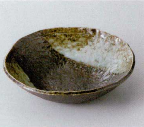
08616-206 900円 252004307 備前太吹中鉢 (170×47mm)