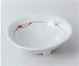
08617-126 920円 251203114 粉引鑄若芽向付 (148×148×45mm)