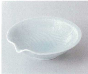
08611-186 950円 251803505 青白磁片口向付 (170×165×52mm)