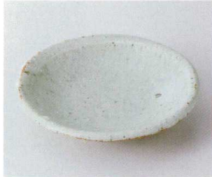
08614-316 910円 253104215 穴窯釉5.0皿 (152×34mm)