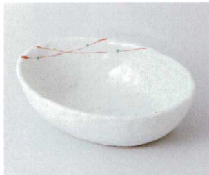
08606-316 760円 253106757 紅万葉4.5小判型鉢 (142×110×36mm) 08607-316 980円 253106758 紅万葉5.5小判型鉢 (172×130×48mm)