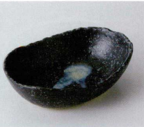
08612-086 1,040円 250804304 銀彩黒精円5.0鉢 (175×134×51mm)