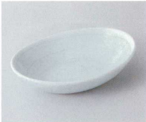
08621-316 880円 253104217 やよい精円鉢 (170×125×39mm)