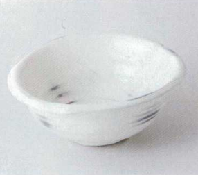
08603-336 1,000円 263308603 化粧流し向付 (160×140×65mm)