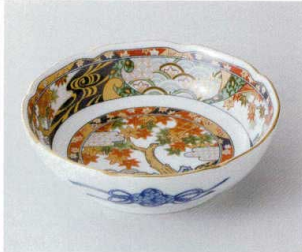
08604-256 980円 252523120 友禅古伊万里生盛 (165×50mm)