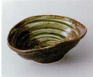
08615-476 900円 264708615 灰釉吹変形向付 (185×155×70mm)