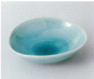
08609-056 960円 260508609 ブルー5.0変形鉢 (160×150×45mm)