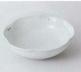
08608-406 980円 264008608 辰砂煮物鉢 (168×50mm)