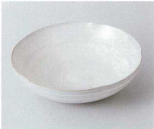
08613-406 930円 254004117 京風唐津5.0鉢 (162×162×46mm)