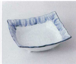
08716-406 800円 264008716 奥入瀬足付刺身鉢 (153×153×52mm)