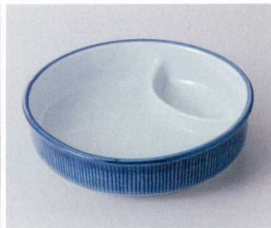
08720-416 760円 254115308 コス巻丸5.5仕切鉢 (160×45mm)