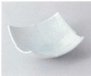
08709-286 1,100円 252803504 青白地向付 (140×50mm)