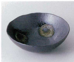
08719-276 760円 252723019 黒南蛮煮物鉢 (165×51mm)