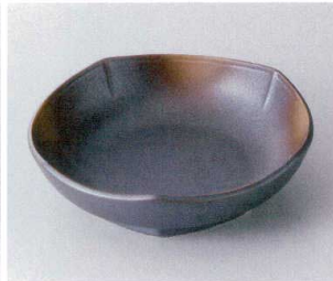
08707-076 940円 260708707 黒伊賀吹五角向付 (158×47mm)