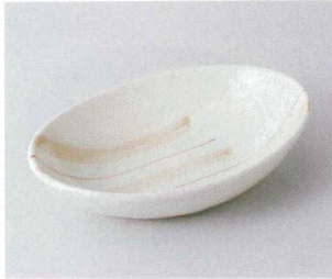
08701-326 860円 253217725 かりんフルーツ鉢 (167×123×35mm)