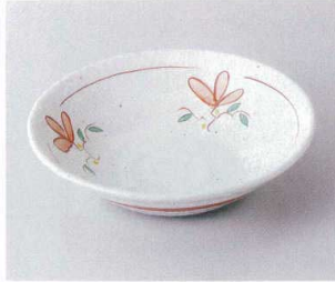
08702-186 850円 251803921 粉引花絵向付 (165×45mm)