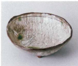
08713-476 900円 264708713 月見うさぎ三ツ足楕円中鉢 (155×140×48mm)