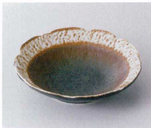
08714-316 920円 253103308 夜明け5.0浅鉢 (160×49mm)