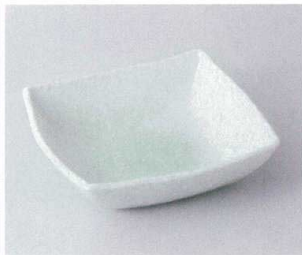
08710-056 820円 260508710 グリーン吹四角中鉢 (155×155×40mm)