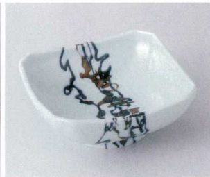
08712-286 800円 262808712 潮路角4.5寸鉢 (138×138mm)