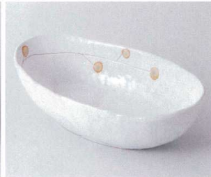
08708-076 840円 250704311 木ノ実精円中鉢 (200×108×58mm)