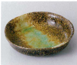
08718-026 770円 250223119 岩清水6.0鉢 (185×45mm)