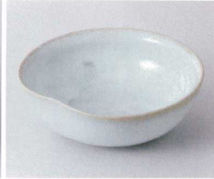
08704-406 850円 254004122 白均窯煮物鉢 (155×148×53mm)