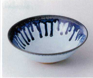
08703-036 850円 260308703 均窯流し平鉢 (120×55mm)