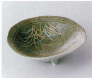
08706-166 850円 251604313 金彩武蔵野三ツ足5.0鉢 (152×45mm)