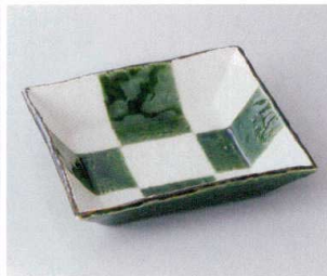
08711-086 810円 250804308 織部格子四角鉢(中) (156×156×34mm)