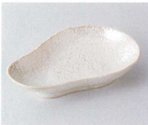
08717-106 800円 251003309 パールヒサコ型向付 (180×125×25mm)