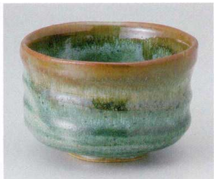
09316-416 1,300円 254105511 青均窯お好み小鉢(98×63mm)