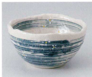
09309-156 1,350円 251505125 土物散小花小鉢(青)(123×63mm)