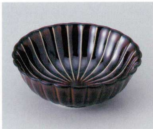
09307-226 1,400円 262209307 漆ブラウン菊割浅小鉢(117×41mm)