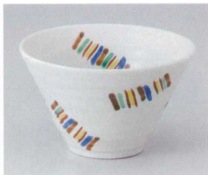
09310-186 1,350円 251805225 マト鎮十草反小鉢(113×70mm)