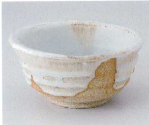
09301-326 1,600円 253204016 ゆらり4.5深鉢(135×67×65mm)