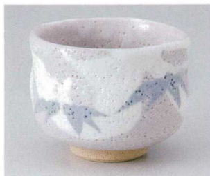
09313-476 1,350円 264709313 紅志野笹野点小鉢(95×75mm)