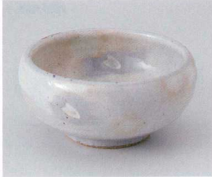
09303-186 1,500円 261809303 粉引捻り小鉢(120×58mm)