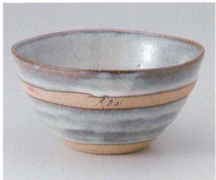
09312-406 1,350円 264009312 うのふ線彫ボール(中)(135×70mm)