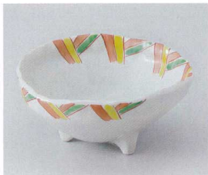
09306-216 1,400円 252105505 三色格子三ツ足小鉢(110×105×50mm)