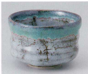
09315-416 1,300円 254105513 青志野お好み小鉢(98×63mm)