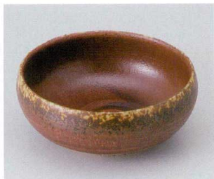
09320-036 1,300円 250305117 赤伊賀4.0玉小鉢(116×45mm)