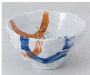
09318-186 1,300円 261809318 錦朱呉須刷毛ケスリ八角小鉢(135×74mm)