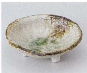
09319-166 1,300円 261609319 灰釉銷流し4.0三ツ足小鉢(136×40mm)