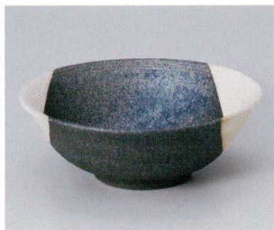
09314-436 1,320円 264309314 黒窯変掛け分け4.5鉢(135×50mm)