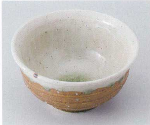
09302-336 1,550円 253305027 ビードロ深口小鉢(123×65mm)