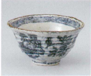
09304-136 1,400円 251305032 古染山水呉須濃4.0鉢(128×123×68mm)