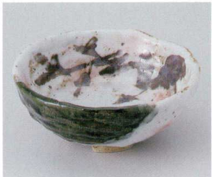
09308-136 1,380円 251305028 オリベ古木小鉢(130×53mm)