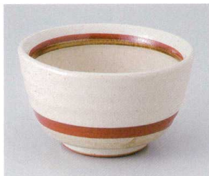
09305-086 1,400円 250851604 灰釉明日香中玉3.8小鉢(110×65mm)