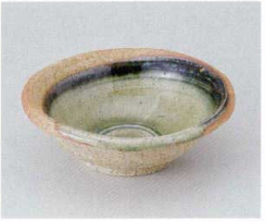
09714-326 680円 253205807 まりも3.0浅鉢 (120×112×40mm)