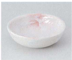
09727-176 640円 261709727 桜志野3.8丸鉢 (115×33mm)