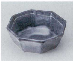
09722-156 660円 251506211 ネズミ志野八角4.0鉢 (125×41mm)