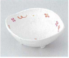
09704-256 710円 262509704 花ちらし三ツ足4.5鉢 (140×60mm)