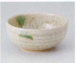
09729-326 630円 253206206 織部流4.0小鉢 (127×54mm)