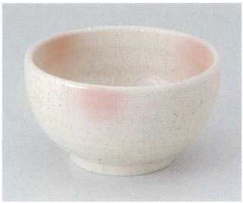
09718-216 680円 262109718 ピンク吹き3.5鉢 (110×61mm)