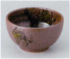
09713-216 680円 262109713 茶織部吹き3.5鉢 (110×60mm)