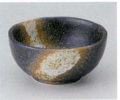
09730-156 630円 251506003 黒備前3.5小鉢 (118×54mm)