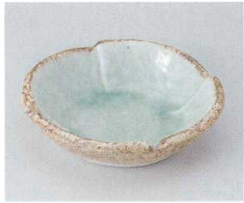
09712-156 680円 261509712 貴入若草玉割 (120×30mm)