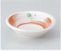
09703-116 720円 251106018 手描刷毛目ソース小鉢 (112×31mm)