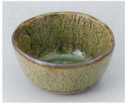
09707-166 700円 251607411 灰釉3.0小鉢 (90×43mm)