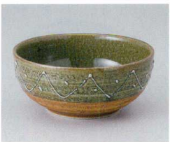
09728-326 630円 253206201 織部オリエント小鉢 (125×55mm)