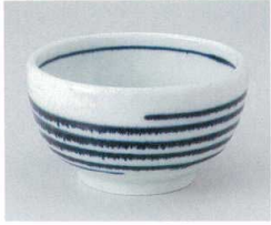
09702-216 720円 262109702 呉須ライン3.5鉢 (110×61mm)