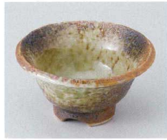
09706-186 700円 251805711 信楽吹丸小鉢 (105×53mm)