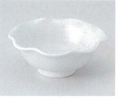
09705-316 710円 253105907 やよい花形小鉢 (123×50mm)