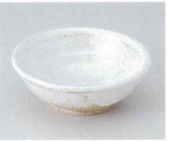
09725-156 640円 251506116 粉引志野玉割 (125×43mm)