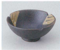
09721-056 660円 250506020 黒伊賀モダン小鉢 (105×50mm)