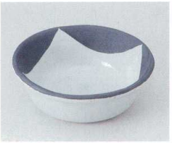
09719-316 670円 253106224 あかり3.6丸小鉢 (113×37mm)