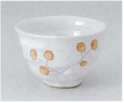
09709-076 700円 250705828 木ノ実深鉢 (105×66mm)