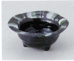
09701-256 720円 262509701 二色十草黒三ツ足小鉢 (115×60mm)