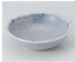
09716-326 680円 263209716 みかげ十草4.5浅鉢 (137×40mm)