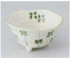
09723-126 650円 251205929 粉引花散三ツ足小鉢 (113×60mm)