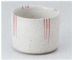
09717-056 680円 260509717 赤十草切立鉢 (90×70mm)