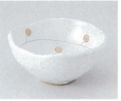
09710-076 700円 250705811 木ノ実丸小鉢 (125×121×58mm)