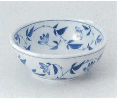
09720-086 670円 250805819 手描唐草4.0ボール (117×47mm)