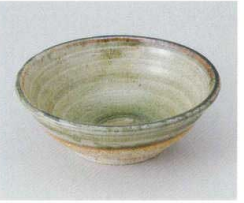
09715-326 680円 253212033 若草4.0玉割 (127×43mm)