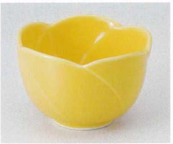
09724-206 650円 262009724 きいろ梅小鉢 (94×63mm)