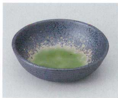
09726-176 640円 261709726 グリーン吹3.8丸鉢 (115×33mm)