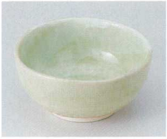
09708-156 700円 251506216 手造り風3.5小鉢よもぎ (117×55mm)