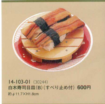
14-103-01 (30244) 白木寿司皿(B) (すべり止め付) 600円 約φ11.7×H1.8cm