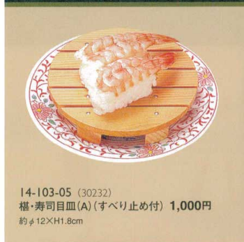
14-103-05 (30232) 樺・寿司皿(A) (すべり止め付) 1,000円 約φ12×H1.8cm