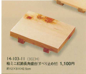
14-103-11 (30234) 桧ミニ紅節長角盛台(すべり止め付) 1,100円 約12×9×H2.5cm