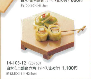
14-103-12 (25763) 白木ミニ盛台六角 (すべり止め付) 1,100円 約12.5×11×H2.5cm