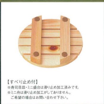
【すべり止め付】 ※寿司皿・ミニ盛台は滑り止め加工済みです。 ※ミニ舟は滑り止め加工がしてありません。 ご希望の場合はお問い合わせ下さい。