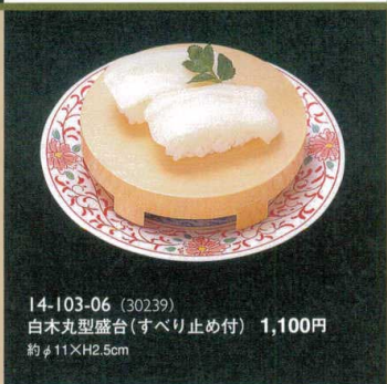
14-103-06 (30239) 白木丸型盛台(すべり止め付) 1,100円 約φ11×H2.5cm