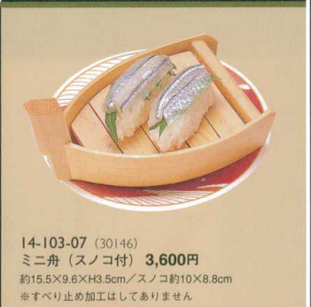
14-103-07 (30146) ミニ舟 (スノコ付) 3,600円 約15.5×9.6×H3.5cm/スノコ約10×8.8cm ※すべり止め加工はしてありません