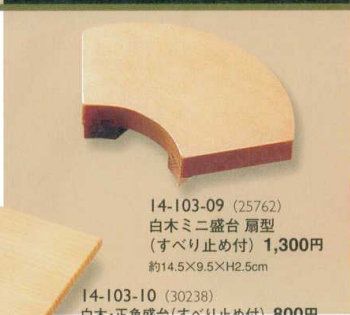
14-103-09 (25762) 白木ミニ盛台 扇型 (すべり止め付) 1,300円 約14.5×9.5×H2.5cm