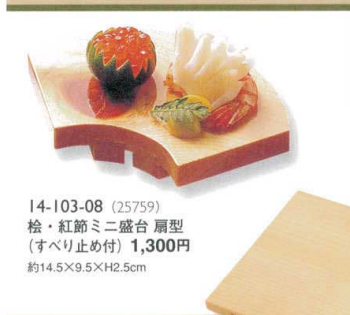
14-103-08 (25759) 桧・紅節ミニ盛台 扇型 (すべり止め付) 1,300円 約14.5×9.5×H2.5cm