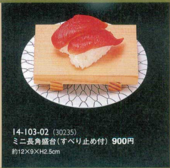
14-103-02 (30235) ミニ長角盛台(すべり止め付) 900円 約12×9×H2.5cm

おすすめのネタや 自慢のネタをのせて。 回転寿司の皿をはずしても お使い頂けます。 お盆にのせやすい ミニサイズは ランチセットに最適です。