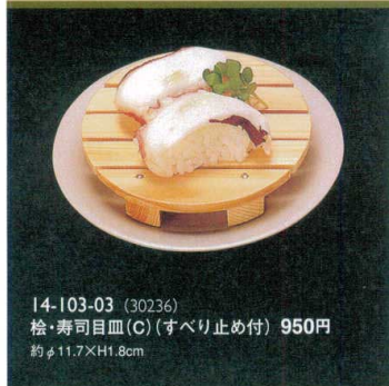
14-103-03 (30236) 桧・寿司皿(C) (すべり止め付) 950円 約φ11.7×H1.8cm

おすすめのネタや 自慢のネタをのせて。 回転寿司の皿をはずしても お使い頂けます。 お盆にのせやすい ミニサイズは ランチセットに最適です。