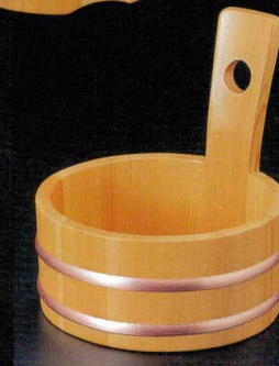
14-112-02 (31202) 椀・京手桶(目皿なし)