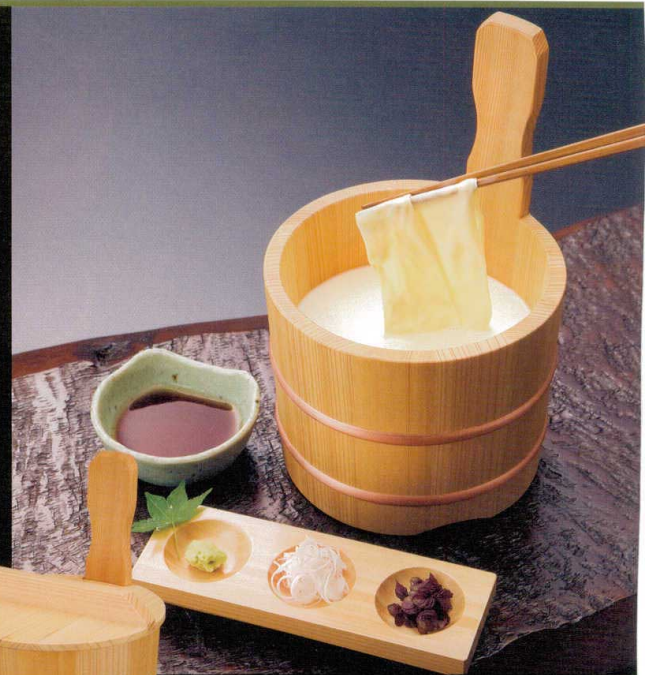
14-112-01 (21520) 椀・汲み上げ湯葉片手桶(蓋付) 約φ14×H22 (12) cm ※陶器薬味皿別売