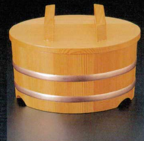
14-112-03 (30220) 椀・ちらし桶(蓋付)