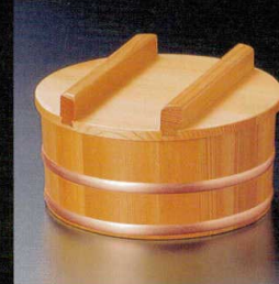
14-112-04 (30210) 椀・ちらし桶 浅型(蓋付)