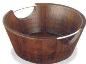
ステンレス取手付クーラー