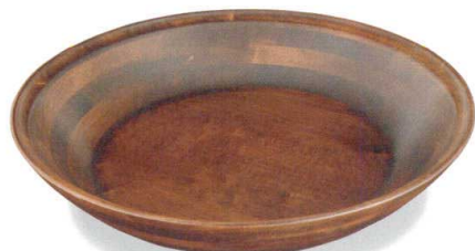
特大丸鉢ベース (古代色)

14-117-03 (45010) 大 8,800円 約φ45×H8cm ※手掛け付