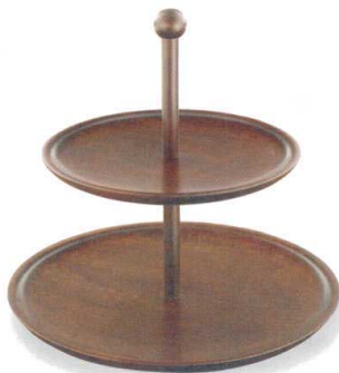
丸二段式デザート皿 (古代色)

木製とステンレスがコンビになったクーラー。ちょっとリッチな演出に最適です。ポウルとしても使用できます。