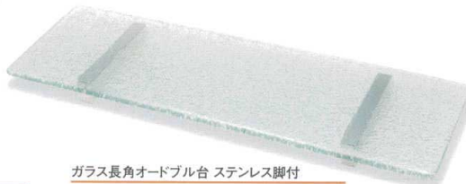
ガラス長角オードブル台 ステンレス脚付 14-123-09 (25947) 14,000円 約61×21×H3.5cm