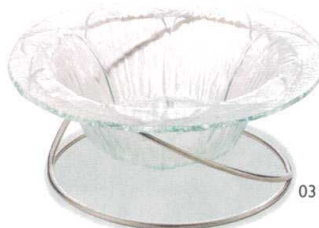
ガラス花びら型盛鉢 14-123-02 (25952) 8,600円 約φ36×H10cm ※ガラス鉢のみ