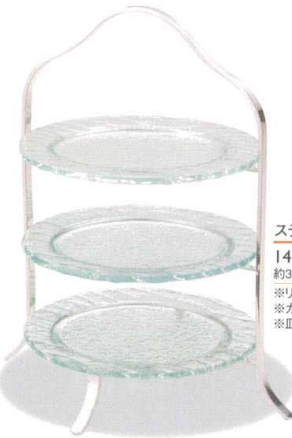
ステンレス縦3段 オードブル盛器 14-123-07 (25943) 26,000円 約34×27×H43cm ※リング内径約φ18.6cm ※ガラス丸皿(約φ25cm)3枚付 ※皿間隔約8.5cm