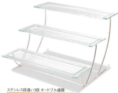
ステンレス段違い3段 オードブル盛器 14-123-06 (25944) 45,000円 約45×45×H31cm ※ガラス長角皿(約45×15cm) 3枚付