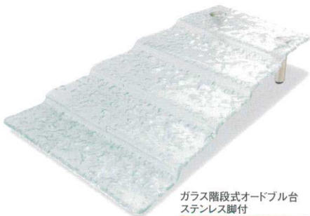
ガラス階段式オードブル台 ステンレス脚付 14-123-08 (25948) 17,000円 約41×60×H11.5cm