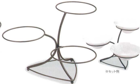
ステンレスリング受台 14-123-03 (25946) 18,000円 約φ32×H15cm ※リング内径約φ30cm ※受台のみ