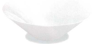
白磁円すい型オードブル鉢 14-123-01 (26406) 7,800円 約φ27×H8.5cm ※アイアン3段ディスプレイベース用白磁鉢です。